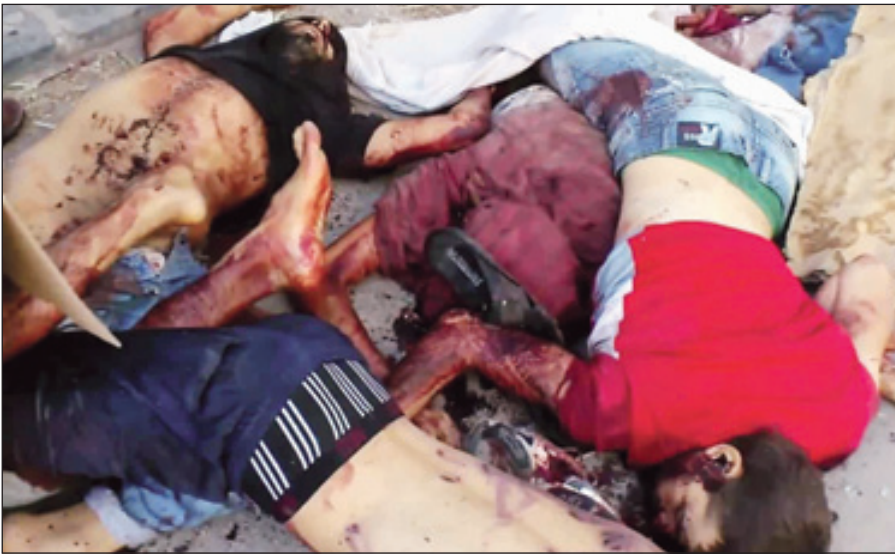
جثامين رجال قتلهم قوات الاسد في حي القابون الدمشقي

معارضين والقوات النظامية، جاءت بعد قصف مركز وعنف طال قرى وبلدات في ريف درعا لا سيما بلدة الحراك التي وقعت فيها اشتباكات عنيفة بعد ساعات من القصف تسبب بـ "سقوط العشرات من القتلى والجرحى". وإشار إلى محاولة قوات النظام "أقتحام المدينة والسيطرة عليها". وقتل في محافظة درعا الإثنين ١٥ شخصاً هم ستة مدنيين وستة عناصر من قوات النظام وثلاثة مقاتلين معارضين.