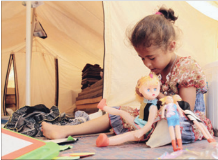
مشكلة اللاجئين السوريين في دول الجوار بدأت تتفاقم

أجنيبة، وقالت وزيرة الخارجية الأمريكية هيلاري كلينتون يوم ١١ أغسطس/ آب إن واشنطن وتركيا تتحان كل الإجراءات اللازمة لمساعدة مقاتلي المعارضة بما في ذلك فرض منطقة حظر جوي لكن لم تقترح أي من الدول الأعضاء في مجلس الأمن التابع للأمم المتحدة رسمياً مثل هذه الخطوة ولم يكتب هذا الخيار قوة دفع كبيرة حتى الآن. وساعدت منطقة حظر جوي وحملة قصف شنها حلف شمال الأطلسي مقاتلي المعارضة الليبية على الإطاحة بالزعيم الراحل معمر القذافي. ولم يظهر الغضب رغبة كبيرة في تكرار أي إجراءات تماثل ما حدث في ليبيا مع سوريا كما أن روسيا والصين تعارضان بشدة التدخل بهذا الشكل. وبدأت تركيا تسليم مساعدات غذائية وغيرها من المساعدات الإنسانية للسوريين على الحدود يوم السبت. ونقل عن داود أوغلو قوله: إن تركيا ستحضر اجتماعاً وزارياً لأعضاء مجلس الأمن المزمع عقده في ٣٠ أغسطس/ آب وستلتمز بأي قرارات تتخذ في الاجتماع.