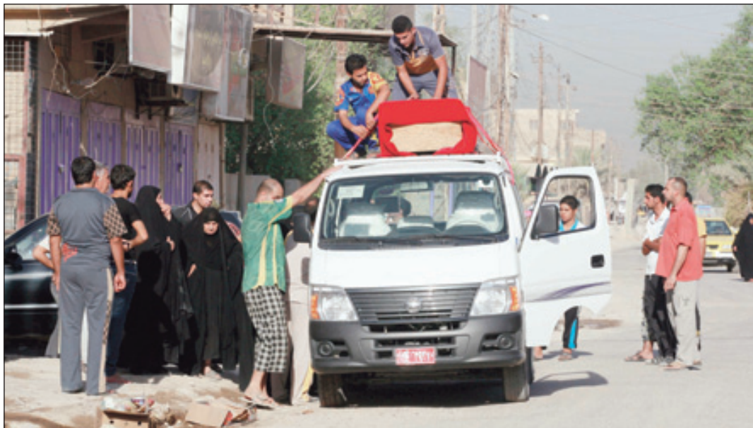
اقارب وأصدقاء رجل قتل في انفجار سيارة يضعون جثمانه على سيارة لتشييعه في بغداد.

وذكرت الشرطة المسؤولة عن حراسة جزر دوكدو أنها زادت من عدد الدوريات الهادفة لمنع وصول مجموعات يمينية يابانية إلى جزر دوكدو من مرة كل أسبوع إلى مرة يومياً. وتنتشر عناصر إضافية للقيام بمهام المراقبة. وتاهبت وكالة الشرطة المتمركزة في جزيرة "أولرونج" (وتبعد ٩٠ كيلومتراً عن دوكدو) لتقديم الدعم الفوري إذا اقتضى الأمر. كما أوضحت الشرطة أنها ستقوم باعتقال الناشطين اليابانيين ستقوم بالشرطة البحرية الكورية الجنوبية في حالة دخولهم الجزر، بموجب قانون الهجرة.