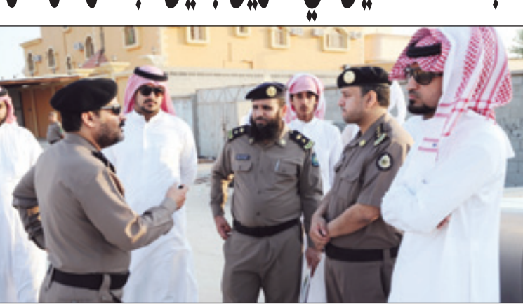
لجنة التحقيق في الحادث وبعض أسر الشهداء