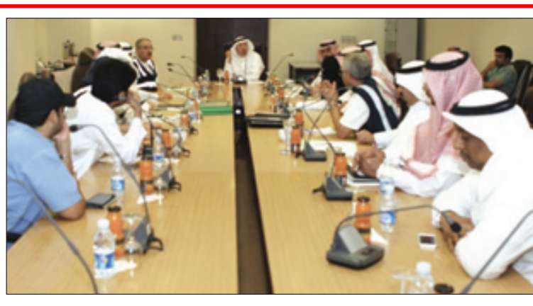
نقاش حول حج العام القادم

بقيق - محمد الغامدي، تصوير - عصام عبدالله أكد محافظ محافظة بقيق سليمان بن حمد بن جبرين، بأن اللجنة التي تتولى التحقيق في قضية حريق عين دار سوف توضح الحقيقة الكاملة بعد انتهاء التحقيق بكل شفافية ولا تهاون مع من يثبت ادانته في هذا الحادث المؤلم كما من كان ابتداء من المحافظة وانتهاء بأصغر إدارة موجودة بالمحافظة وكل ذلك سوف يعلن بعد انتهاء التحقيقات. وأوضح بأن هذا المصاب الجلل مصاب الوطن مقدماً التعازي لأهالي المتوفين داعياً لهم بالرحمة والمغفرة، متمنياً الشفاء العاجل للمصابين إن شاء الله. وأشار إلى انه صدرت توجيهات صاحب السمو الملكي الأمير محمد بن فهد أمير المنطقة الشرقية بتشكيل لجنة برئاسة المحافظ وعضوية الجهات الأمنية المختصة الأخرى لمعرفة الأسباب وتقصي الحقائق ومعرفة الملباسات. وقال ابن جبرين فقدنا "٢٤" شخصاً في حادث مؤلم ومأساوي ولا نريد مزيداً من الحوادث المؤلمة في المستقبل وسوف تبذل اللجان المشكلة كل جهودها لمعرفة الأسباب