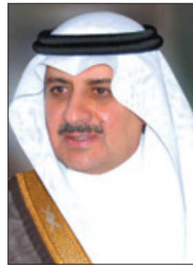
فهد بن سلطان

تبوك - عودة المطوي رفع صاحب السمو الملكي الأمير فهد بن سلطان بن عبدالعزيز أمير منطقة تبوك باسمه ونياحة عن أهالي المنطقة أصدق التهاني لخادم الحرمين الشريفين الملك عبدالله بن عبدالعزيز آل سعود - حفظه الله - بمناسبة نجاح موسم الحج لهذا العام ١٤٣٣هـ. وقال سموه في برقية رفعها للملك المفدى: "يشرفني باسمي ونياحة عن كافة أهالي منطقة تبوك أن أرفع إلى مقامكم الكريم أصدق التهاني بمناسبة نجاح موسم الحج لهذا العام ١٤٣٣هـ، وما تحقق من تميز في تنفيذ جميع الخطط الأمنية والخدمية، والتي كان لها الأثر الكبير في أن يؤدي حجاج بيت الله الحرام نسكهم في خشوع ويسر وسهولة، وهو ما يجسد حرص وإشراف سيدي خادم الحرمين الشريفين وسموكم الكريم حفظكم الله على كل ما من شأنه خدمة الإسلام والمسلمين، سائلاً المولى القدير أن يمدكم بعونه وتوفيقه سندا وعضدا لخادم الحرمين الشريفين وولي عهده الأمين لخدمة دينكم.