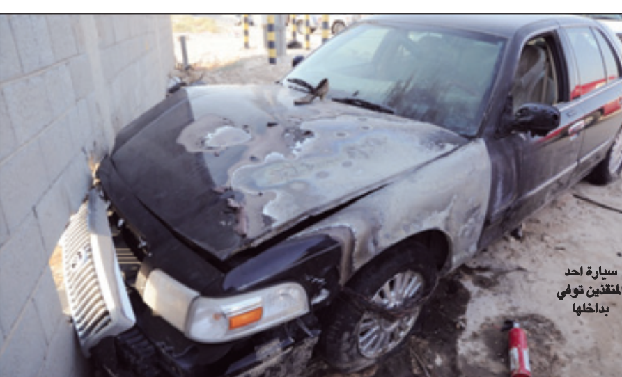
سيارة احد المتقنين توفي بداخلها