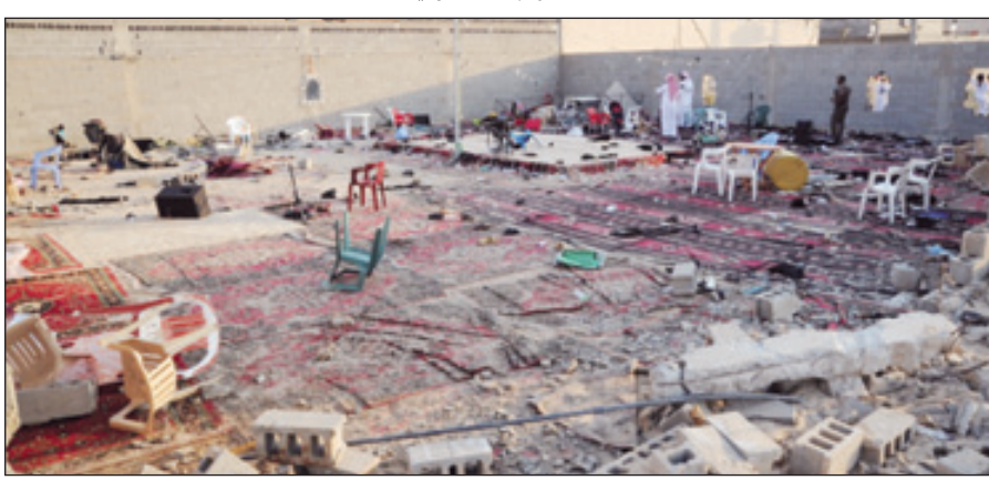
موقع الاحتفال بعد الحادثة