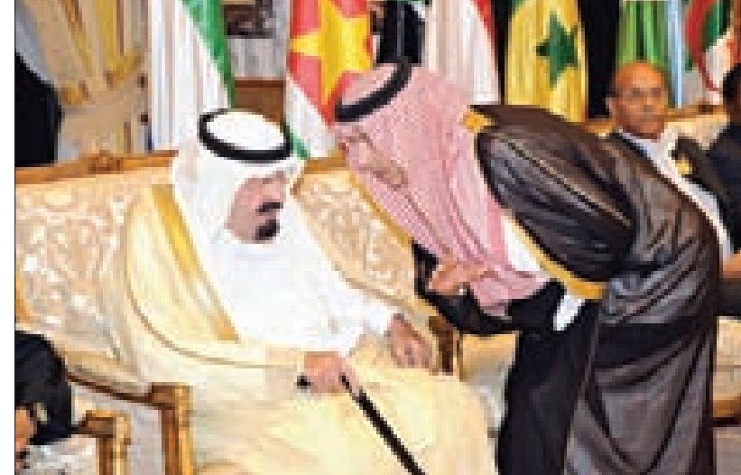
حديث بين خادم الحرمين وسمو الأمير عبدالعزيز بن عبد الله. (و.أ.س.)