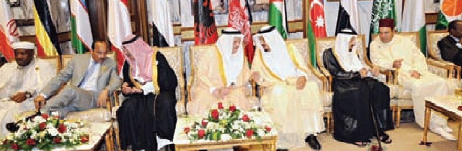
الأمير سلمان يتبادل الحديث مع الأمير عبدالإله بن عبدالعزيز آل سعود خلال استقبال خادم الحرمين لإخوانه القادة ورؤساء الوفود.