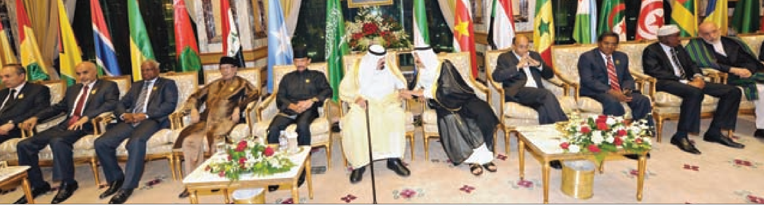
الملك عبدالله مستقبلاً إخوانه القادة ورؤساء الوفود المشاركة بالقمة في قصر الصفا قبيل الجلسة الختامية.

وإخوانه قادة ورؤساء وفود الدول الإسلامية بهذه المناسبة. حضر الاستقبال صاحب السمو الملكي الأمير متعب بن عبدالعزيز آل سعود وصاحب السمو الملكي الأمير سلمان بن عبدالعزيز آل سعود ولي العهد نائب رئيس مجلس الوزراء وزير الدفاع.