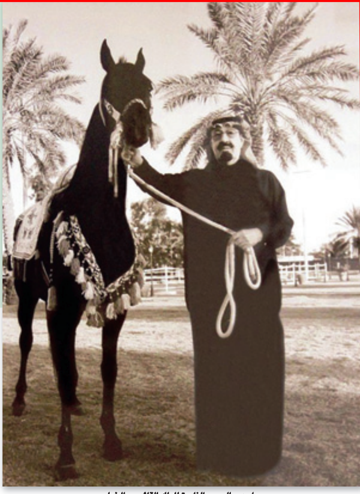
إحدى الصور النادرة للملك القائد مع الخيل

دوراً مهماً لنشر الوعي بالمكتبة وأهمية دورها الوطني والعالمي؛ حيث تحولت مكتبة الملك عبدالعزيز العامة من مجرد كونها مكتبة كبرى إلى بيئة ثقافية، من خلال تقديمها حزمة من المشروعات الثقافية طويلة الأمد، وقامت المكتبة بتصميم آلية جديدة لخدمة المرتادين والباحثين. وأكد ابن معمر أن مكتبة الملك عبدالعزيز العامة، أصبحت في وقتنا الحاضر من أهم المؤسسات العربية التي تنشر الثقافة والمعرفة بين جميع أفراد المجتمع، برصيدها، وبحثها وبمساهمتها الجليلة في حفظ التراث المخطوط والمطبوع بالإضافة إلى الجوانب والوظائف الأخرى، وقبل ذلك بتوفير الله عز وجل، ثم بدعم ورعاية خادم الحرمين الشريفين الملك عبدالله بن عبدالعزيز، أيده الله، الذي له الفضل الأكبر بعد الله في ذلك