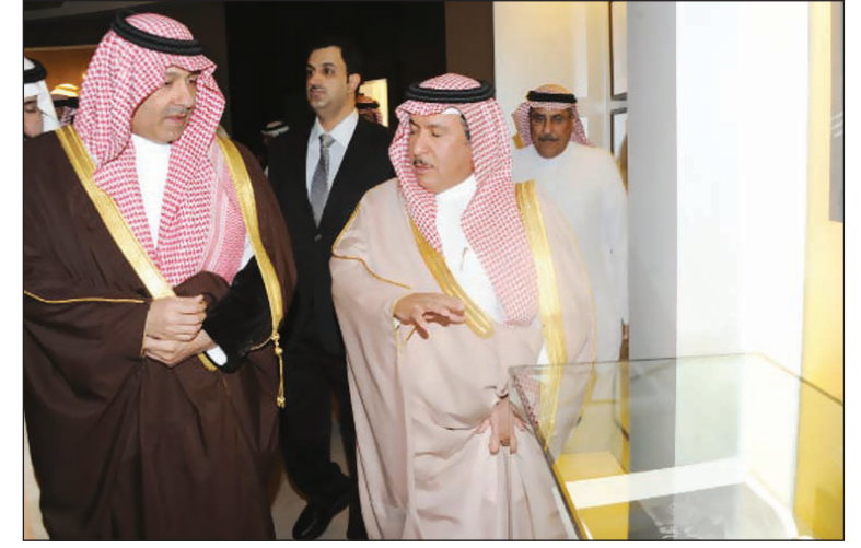
سموه يتجول في معرض صور خادم الحرمين