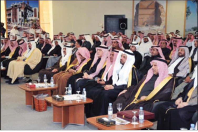
جانب من حضور حفل تدهين الموسوعة

الأمير عبدالعزيز بن عبدالله: إنجاز وطني استغرق ١٠ سنوات من العمل الدؤوب ١٩٢ صورة تاريخية توثق مسيرة الملك القائد عبر محطات مختلفة