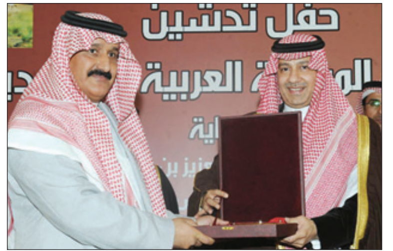
.. ويكرم المشاركين في إعداد الموسوعة