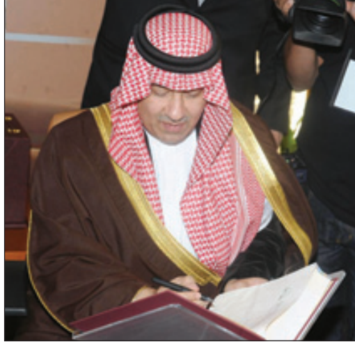
نائب وزير الخارجية يدشن الموسوعة

حضر الحفل عدد من أصحاب المجالس الوزراء وعدد من المثقفين والأدباء والمهتمين.