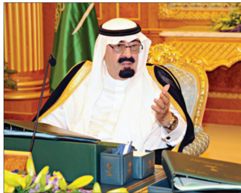
الملك عبدالله يرأس الجلسة