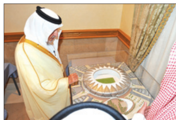
الأمير خالد الفيصل يطلع على مجسمات مدينة الملك عبدالله الرياضية

صالح الرويس: أطلع صاحب السمو الملكي الأمير خالد الفيصل بن عبدالعزيز أمير منطقة مكة المكرمة أمس، على تصاميم مشروع مدينة الملك عبدالله الرياضية بجدة، التي قدمها له وفد من شركة أرامكو المكلفة بإدارة المشروع. وشهد سمو الأمير خالد الفيصل عرضاً مرئياً ومجسمات حية لما سيكون عليه المشروع المتوقع الانتهاء منه في عام ٢٠١٤، موضحاً فيها تفاصيل البناء وشكله الخارجي وسعته ومحتوياته من ملاعب ومرجعات ومرافق خاصة وعامة. وطالب سموه من إدارة المشروع أن تأخذ في الاعتبار مراعاة ربط مداخل الملعب ومخارجه بطرق المدينة في انسيابية تامة، ودراسة العلاقة بين المشروع والمشاريع الكبيرة المجاورة له، إضافة إلى الكثافة المرورية وحركة السير في الموقع بمحاذاة جدة التي ستشهد استعانة بوسائل النقل العام خلال السنوات المقبلة، إلى جانب تنسيق الجهود مع الجهات المعنية المختلفة وإدارة مشروع تصريف مياه الأمطار والسيول الجاري تنفيذه في المدينة، إلى جانب ضرورة التركيز في التصميم على وضع بصمة تظهر الطابع الإسلامي، كون مدينة جدة