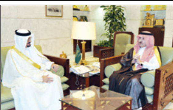
الأمير سطاتم مستقبلاً السفير البحريني