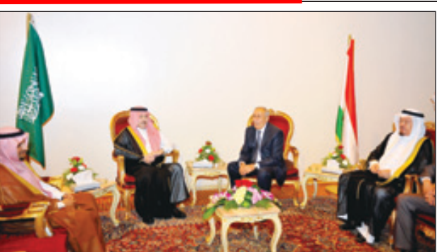
الأمير سطاتم حاضراً للحفل

الفنية وفقاً لما نصت عليه المادة (الرابعة) من مشروع مذكرة التفاهم بينهما. ثالثاً: قرر مجلس الوزراء الموافقة على إعادة تشكيل اللجنة الاستثنائية الخاصة بمنازعات الأوراق المالية لمدة ثلاث سنوات اعتباراً من تاريخ صدور هذا القرار، وذلك على النحو الآتي: ١. الأستاذ عبدالله بن عبدالعزيز الشدي من هيئة الخبراء بمجلس الوزراء رئيساً. ٢. الأستاذ عبدالعزيز بن راشد بن كليب من وزارة التجارة والصناعة عضواً. ٣. الأستاذ سالم بن صالح المطوع من وزارة المالية عضواً رابعاً: وافق مجلس الوزراء على تعيينات ونقل بالمرتبتين الخامسة عشرة والرابعة عشرة ووظيفتي (سفير) و (وزير مفوض)، وذلك على النحو التالي: ١. تعيين سمو الأمير منصور بن خالد بن عبدالله الفرخان آل سعود على وظيفة (سفير) بوزارة الخارجية. ٢. تعيين المهندس صالح بن عبدالعزيز بن عبدالله الخضوب على وظيفة (مستشار للشؤون الفنية) بالمرتبة الخامسة عشرة بأمانة منطقة الرياض. ٣. تعيين خالد بن عبدالله بن عبداللطيف العبد اللطيف على وظيفة (وكيل الوزارة لشؤون الأوقاف) بالمرتبة الخامسة عشرة بوزارة الشؤون الإسلامية والأوقاف والدعوة والإرشاد. ٤. تعيين مسفر بن عبدالرحمن بن عوض آل غاصب على وظيفة (وزير مفوض) بوزارة الخارجية. ٥. تعيين عبدالرحمن بن عبدالله بن عبدالعزيز الرضيان على وظيفة (مدير عام مكتب الوزير) بالمرتبة الرابعة عشرة بوزارة الشؤون الاجتماعية. ٦. نقل بدر بن سالم بن مزاحم باجابر من وظيفة (مستشار تخطيط وتنمية الموارد البشرية) بوزارة العمل بالمرتبة الرابعة عشرة وتعيينه على وظيفة «أمين عام لجنة» (اللجنة الدائمة لمكافحة جرائم الأشخاص) بذات المرتبة بهيئة حقوق الإنسان.