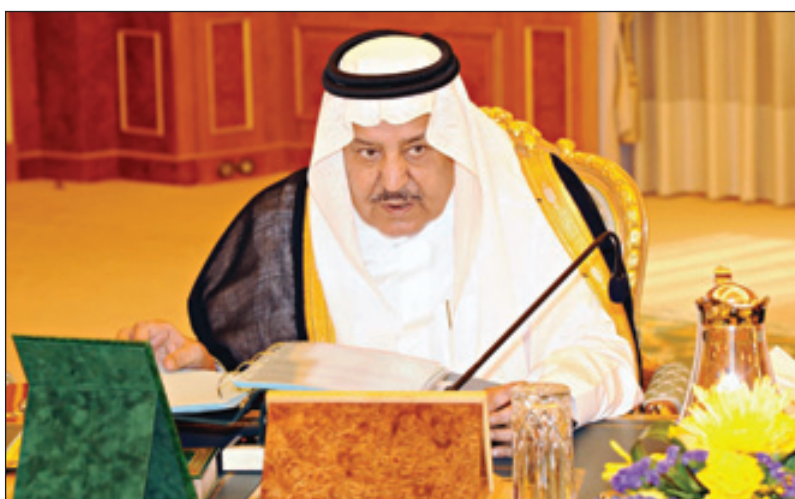
الأمير نايف خلال حضوره الجلسة

وأشار معالي وزير الثقافة والإعلام، إلى أن مجلس الوزراء استعرض إثر ذلك تطور الأحداث ومستجداتها عربياً وإقليمياً ودولياً، ودان التجسير الذي تعرضت له العاصمة الصومالية مقديشو وتسبب في مقتل وإصابة المئات، وعده عملاً إجرامياً يتنافى مع تعاليم الدين الإسلامي، معرباً عن تعازي المملكة لحكومة وشعب الصومال وأسر الضحايا وتمنياتها للمصابين بالشقاء. وندد مجلس الوزراء بمواصلة المستوطنين اليهود والجماعات اليهودية المتطرفة انتهاك الأماكن المقدسة في الأراضي الفلسطينية، ومن ذلك حرق مسجد النور الكبير في قرية طوبا في الجليل الأعلى،