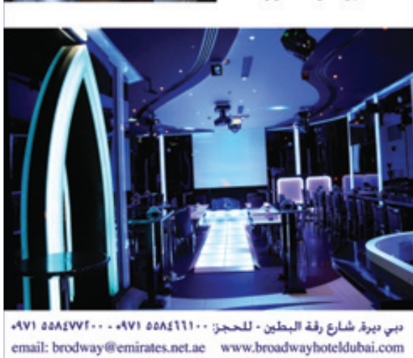
بني ديرة شارع رفة البطين - للحجز: ٥٥٤٦١١٠ - ٥٥٤٦٧٧٠ - ٤٧١ email: broadway@emirates.net.ae www.broadwayhoteldubai.com