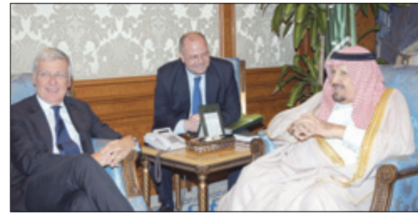
الأمير عبدالرحمن خلال الاستقبال

تشرف صاحب السمو الملكي الأمير عبدالرحمن بن عبدالعزيز نائب وزير الدفاع والطيران والمفتش العام بالسلام على رسول الله صلى الله عليه وسلم وادى الصلاة في المسجد النبوي الشريف من جهة أخرى شرف الأمير عبدالرحمن حفل العشاء الذي أقامه على شرف سموه الأستاذ بندر بن خربوش الذويبي وكيل أمير الفوج السادس للحرس الوطني بمنطقة المدينة المنورة حيث أشاد