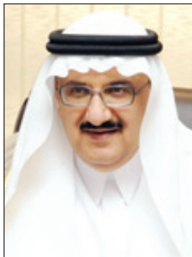
الأمير منصور بن متعب

وتضمنت المشروعات التي وقعها سموه في مكتبه بالوزارة مؤخرًا مشروع سفلنة وأرصفة وإنارة للبلديات التابعة لأمانة منطقة المدينة المنورة بمبلغ وقدره (٦٦,٩٣٣,٩٢٥) ريالاً، ومشروع استبدال أعمدة الإنارة التالفة بشرق وجنوب مكة المكرمة بمبلغ إجمالي وقدره (٨,٢٩٧,٠٠٠) ريالاً، ومشروع درء أخطار السيول وتصريف مياه الأمطار للبلديات التابعة لأمانة منطقة الرياض بمبلغ وقدره (٣٩,٣٠٥,٤٦٦) ريالاً، ومشروع تنفيذ جسور على الأودية بالمدينة المنورة مرحلة خامسة بمبلغ وقدره (٢٩,٩٩٩,٢٤٧) ريالاً، ومشروع استكمال إنارة شوارع أحياء الرياض الجزء الثاني