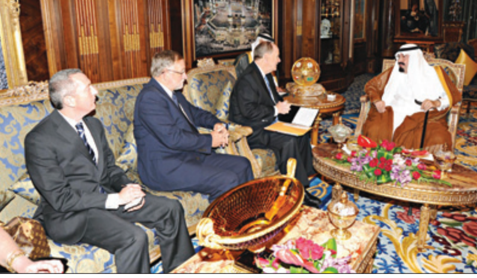
الملك عبدالله لدى استقباله مستشار الرئيس الأميركي والوفد المرافق.

لتفاصيل أرسل SMS إلى الرقم 88522 تبدأ بالرمز (100)، ثم الرسالة