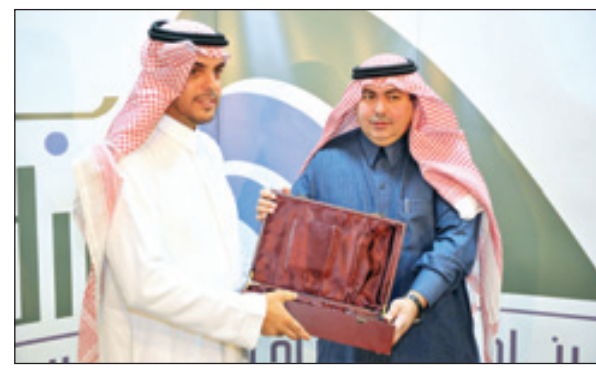
الأمير الدكتور تركي بن سعود يري حفل تخريج مشروعات ببرنامج «بادر»

أكد صاحب السمو الأمير الدكتور تركي بن سعود بن محمد نائب رئيس مدينة الملك عبدالعزيز للعلوم والتقنية لمعهد البحوث أن الدور الرائد الذي تطلع به المدينة ممثلة في برنامج بادر لحاضنات التقنية في دعم ورعاية المبدعين ورواد الأعمال التقنية بالمملكة ومساعدتهم في تحويل أفكارهم إلى مشاريع استثمارية تقنية ناجحة ذات جدوى اقتصادية قيمة