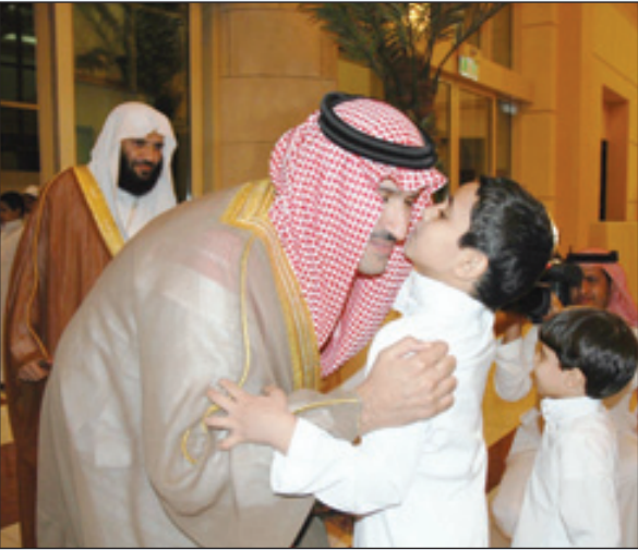
الأمير فيصل وقبلة حانية لأحد الأيتام