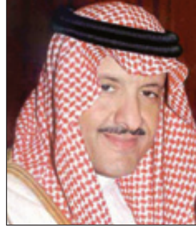
الأمير سلطان بن سلمان

مبادرات إنسانية متفردة في الاهتمام والدعم لاحتياجات الأطفال، معوقين كانوا أو أيتام، أو معوزين، أو سياميين، أو مصابي حرب، أو ضحايا كوارث جعل المملكة العربية السعودية نموذجاً لدولة إنسانية، الأمر الذي نجني ثماره الآن مظلة متميزة من الخدمات والحقوق". ودعا الأمير سلطان الله العلي القدير أن يثيب خادم الحرمين الشريفين خير الثواب، وأن يجعل ذلك في ميزان حسناته.