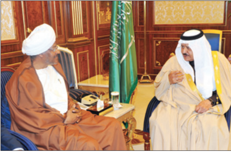
الأمير نايف يستقبل السفير السوداني

الدمام. عوض المالكي وجه خادم الحرمين الشريفين الملك عبد الله بن عبد العزيز آل سعود. حفظه الله. شكره لصاحب السمو الملكي الأمير محمد بن فهد بن عبد العزيز أمير المنطقة الشرقية بمناسبة اطلاعه. حفظه الله. على العدد التاسع من مجلة (شرقية) التي