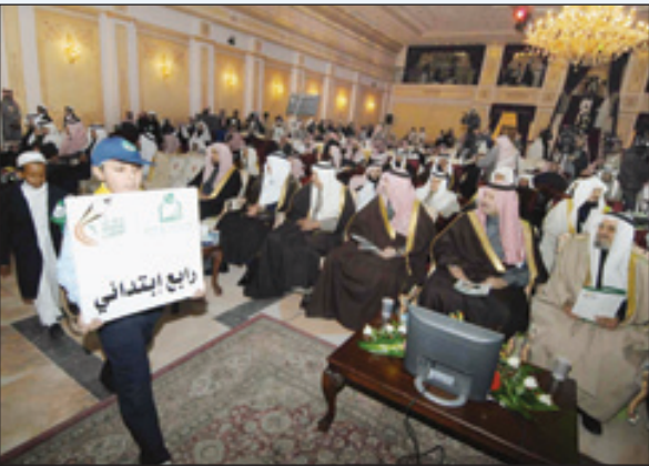
سموه مشرفاً لأحد احتفالات إنسان