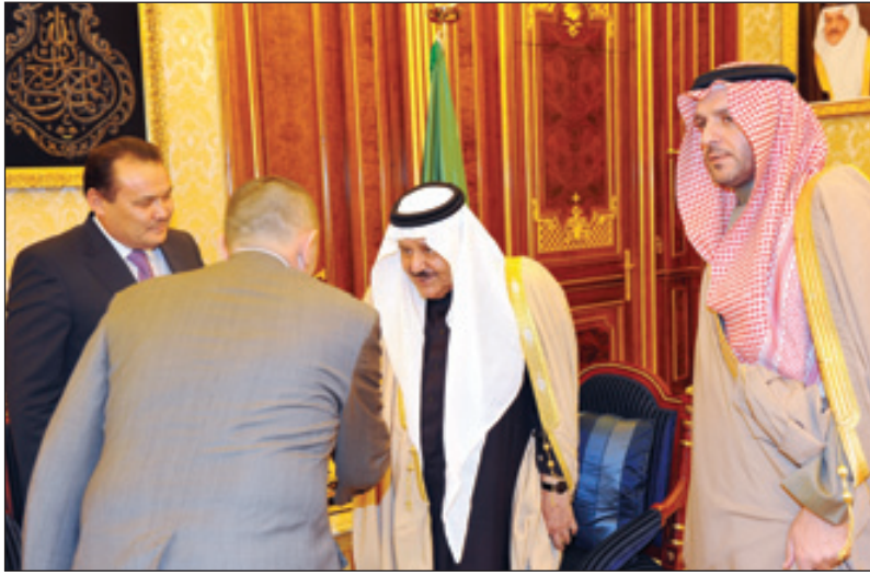
الأمير نايف يستقبل المبعوث الكازاخستاني