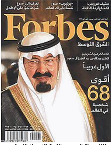
غلاف مجلة (فوربس- الشرق الأوسط) الذي تصدره خلالها صورة الملك عبد الله

واختتمت رئيس تحرير مجلة "فوربس" قولها، بأن: بيل غيتس، مؤسس مايكروسوفت فرض نفسه خامساً في هذه القائمة، رغم أنه خسر صدارة أغنياء العالم، لصلحة كارلوس سليم الطولو، إلا أنه بفضل مساهماته الخيرية ومشاريعه الاجتماعية، بالإضافة إلى التأثير الكبير لشركته مايكروسوفت احتل صدارة رجال الاقتصاد. وقد جاء ضمن تصنيف مجلة فوربس الأمريكية المتخصصة في الاقتصاد