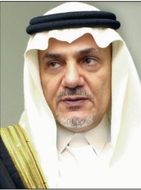
الامير تركي الفيصل

الاجلس البلدية. وعرض سمو الأمير تركي الفيصل في كلمته التي كانت بعنوان "التاريخ السياسي للمملكة العربية السعودية" المراحل التاريخية التي مرت بها المملكة العربية السعودية منذ توحيد أجزائها بقيادة الملك المؤسس عبدالعزيز بن عبدالرحمن الفيصل آل سعود رحمه الله. وأشار إلى الأسس القوية التي قامت عليها المملكة ومن أهمها التمسك بالعقيدة الإسلامية شرعاً ومنهجاً. وقال سموه "إن الملك عبدالعزيز رحمه الله دعا إلى انعقاد أول مؤتمر إسلامي في مكة المكرمة عام ١٩٢٦م وأكد في كلمته أمام المؤتمر حاجة المسلمين إلى تجاوز الخلافات الطائفية والسياسية". وأضاف سموه إن نهضة المملكة انطلقت منذ نهاية