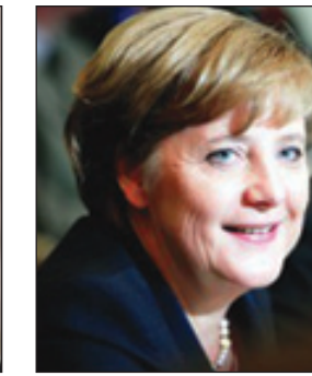
المستشارة الألمانية أنجيلا ميركل

التقى عمدة روشستر وعدداً من المبتعثين السعوديين... وألقى كلمة في جامعة ولاية نيويورك.. الأمير تركي الفيصل: توطيد الأمن وانتهاج الإصلاح وتحقيق تطورات المواطنين إنجازات كبرى في عهد خادم الحرمين