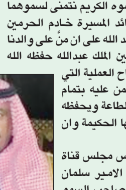
مشعل بن حطين

عبد العزيز نائب أمير منطقة الرياض وصاحب السمو الملكي الأمير سعود بن نايف رئيساً لديوان سمو ولي العهد. وقال الشيخ بن حطين الأمير سلمان بن عبدالعزيز له أعمال وجهود مشهودة ومعروفة في نبضة الوطن وخدمته والعمل مع القيادة السياسية لرفعة وعزة الوطن وكذلك الحال مع الأمير سطاتم بن عبدالعزيز وسموهم خدمتا سنوات طوال لصالح الوطن والمواطن. وهذا أحمد الجبلي الأمين العام المساعد لمجلس الشورى الشعب السعودي والقيادة الحكيمة بتعيين صاحب السمو الملكي الأمير سلمان بن عبدالعزيز وزيراً للدفاع والإمير سطاتم بن عبدالعزيز أميراً لمنطقة الرياض على الثقة الملكية الكريمة وترفع التهنيئة لصاحب السمو الملكي الأمير سلمان بن عبدالعزيز أمير منطقة الرياض وللقيادة الحكيمة على الاختيار الموفق لخدمة الوطن ومواصلة مسيرة الخير والنماء في ظل الحياة الكريمة التي تعيشها بلادنا والله الحمد تحت قيادة مقام خادم الحرمين الشرفين الملك عبدالله بن عبدالعزيز أيده الله.