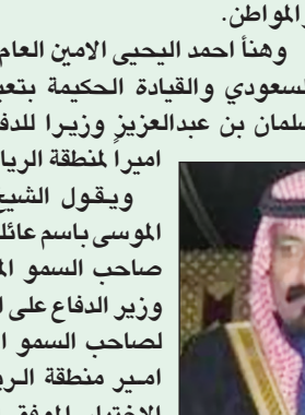
ضاري بن طوالة

وتعيين الأمير سطاتم أميراً للرياض من الأخبار التي تسر كل متابع يعلم بالجهود المباركة التي يقوم بها سموه الكريم لتمني لسموهم المزيد من التوفيق والنجاح في ظل قائد المسيرة خادم الحرمين الشرفين وسمو ولي عهده الأمين ونحمد الله على أن من على والدنا ومليكنا الفدي خادم الحرمين الشرفين الملك عبدالله حفظة الله وأم عليه موفور الصحة والعافية بنجاح العملية التي اجريت لمقامه الكريم وتدعو الله أن يمن عليه بنتمام الشفاء العاجل وأن يمد في عمره على الطاعة وحفظه من كل مكروه وأن يحفظ بلادنا وقيادتها الحكيمة وأن يعزمه وينصرهم. ويقول الشيخ مشعل بن حطين رئيس مجلس قناة الصحراء هنيئاً لصاحب السمو الملكي الأمير سلمان بن عبدالعزيز بتعيينه وزيراً للدفاع ولصاحب السمو الملك الأمير سلطان بتعيينه أميراً للرياض ولصاحب السمو الملكي الأمير خالد بن سلطان نائباً لوزير الدفاع وصاحب السمو الملكي الأمير محمد بن سعد بن