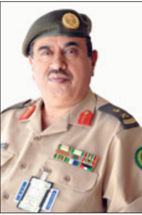
اللواء مبارك القحطاني

اللواء خالد الحسيني الحارثي ■ رفع مدير إدارة مستشفيات القوات المسلحة بمنطقة الطائف اللواء مبارك بن عبد الله القحطاني أسمى آيات التهاني والتبريكات لمقام صاحب السمو الملكي الأمير سلمان بن عبدالعزيز بمناسبة صدور الأمر الملكي الكريم بتعيينه وزيراً للدفاع خلفاً لسمو الأمير سلطان بن عبد العزيز رحمة الله وأسكنه فسيح جناته. وقال إن هذا القرار الحكيم إنما يجسد بجلاء أن مدرسة عامر المؤسس عبدالعزيز -رحمة الله تعالى- عامرة بقيادة أبنائه بلمكان القيادة السياسية وموروثة لسموهم كما أنهم يحملون هم الوطن ومواطنيه والإرتقاء به إلى معالي الأمور. وأشار اللواء القحطاني إلى أن فقد سمو الأمير