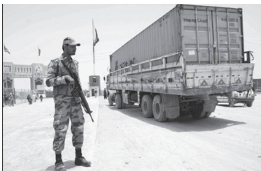
أول شاحنة امداد لدى عبورها نقطة حدودية باكستانية

شامان (باكستان) - أ.ف.ب ■ عبرت اولى شاحنات التعميم التابعة للحلف الاطلسي الحدود الباكستانية الى افغانستان امس بحسب مسؤولين بعدما رفعت اسلام آباد الحظر الذي تفرضه منذ سبعة اشهر نتيجة أزمة دبلوماسية بين اسلام اباد وواشنطن، على ما افاد مسؤولون باكستانيون على الحدود. واوضحت المصادر ان ثلاث شاحنات محملة بمياه معدنية لقوات الحلف الاطلسي عبرت المعبر الحدودي في شامان جنوب غرب باكستان ودخلت جنوب افغانستان. وقعت واشنطن ونيشنل اسلام آباد الغلاء اتفاقا يسمح باستئناف عبور قوافل امدادات قوات حلف شمال الاطلسي في افغانستان، بعد أن توقف اثر مقتل ٢٤ جنديا باكستانيا في قصف لايساف على منطقة حدودية باكستانية في تشرين الثاني/نوفمبر ٢٠١١. وادى هذا الخطأ الى تفاقم التوتر في العلاقات بين واشنطن واسلام اباد التي كانت اصلا متدهورة منذ العملية التي شنتها وحدة كومندوس اميركية في شمال باكستان وادت الى تصفية اسامة بن لادن في ايار/مايو ٢٠١١. وينص الاتفاق المبرم هذا الاسبوع خصوصا على منح مساعدة اميركية قيمتها ١.١ مليار دولار للجيش الباكستاني، كانت واشنطن جمدتها السنة الماضية. واتسار الاتفاق ارتياح