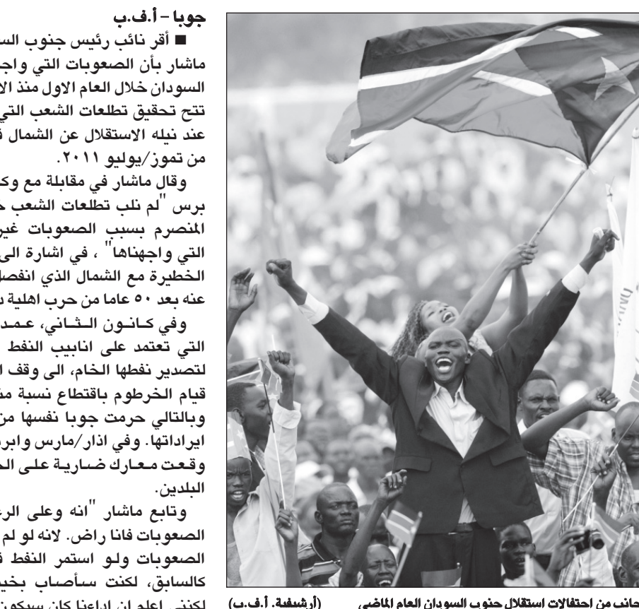
جانب من احتفالات استقلال جنوب السودان العام الماضي

جوبا - أ.ف.ب ■ أقر نائب رئيس جنوب السودان ريك مانشار بأن الصعوبات التي واجهها جنوب السودان خلال العام الاول منذ الاستقلال لم تتح تحقيق تطلمات الشعب التي عبر عنها عند نيله الاستقلال عن الشمال في التاسع من تموز/يوليو ٢٠١١. وقال مانشار في مقابلة مع وكالة فرانس برس «لم تلب تطلمات الشعب خلال العام المنصرم بسبب الصعوبات غير المتوقعة التي واجهناها»، في إشارة الى التوترات الخطيرة في الشمال الذي انفصل الجنوب عنه بعد ٥٠ عاما من حرب أهلية دامية. وفي كانون الثاني، عمدت جوبا، التي تعتمد على انابيب النفط السودانية لتصدير نفطها الخام، الى وقف الانتاج اثر قيام الخرطوم باقتطاع نسبة منه لنفسها، وبالتالي حرمت جوبا نفسها من ٩٨٪ من إيراداتها. وفي آذار/مارس وابريل/نيسان وقعت معارك ضارية على الحدود بين البلدين. وتابع مانشار «انه وعلى الرغم من كل الصعوبات فانا راض. لانه لو لم تشهد هذه الصعوبات ولو استمر النفط في التدفق كالسابق، لكنت سأصاب بخيبة الامل. لكنني اعلم ان ادعاءنا كان سيكون افضل لو