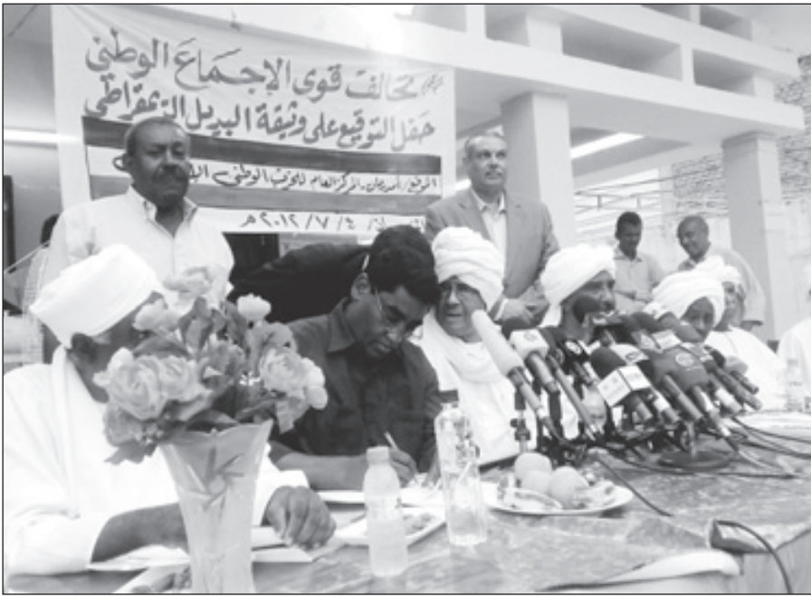
المعارضة السودانية توقع وثيقة «البديل الديمقراطي»

الخرطوم - بليغ حسب الله ■ أجاز المكتب القيادي لحزب المؤتمر الوطني الحاكم في السودان الذي انعقد الليلة قبل الماضية برئاسة الرئيس عمر البشير تخفيض ٥ وزارات اتحادية، و١٢ وزير دولة، في وقت وقعت قوى معارضة على وثيقة اسمتها «البديل الديمقراطي» تركز على اسقاط الحكومة الحالية وتشكيل اخرى انتقالية. وغادر الخرطوم تسعة من وزراء حزب المؤتمر الوطني، وثلاثة من القوى السياسية المشاركة، وأبقى التغيير الجديد على ٢٦ وزيرا اتحاديا. وقال مساعد الرئيس السوداني نافع علي نافع، نائب رئيس الحزب الحاكم، في تصريحات صحفية عقب اجتماع المكتب القيادي أن الاجتماع أبقى على ٢٦ وزيرا اتحاديا بدلا عن ٣١ وزيرا. وأضاف أن الاجتماع ألغى وزارة التعاون الدولي، ودمجها في وزارتي الخارجية والمالية، كما دمجت وزارات الإعلام والثقافة والإرشاد في وزارة واحدة، وأخذ نافع أن عملية الدمج شملت أيضا وزارتي الاتصالات والتقانة، بجانب دمج وزارتي الموارد البشرية والعمل.