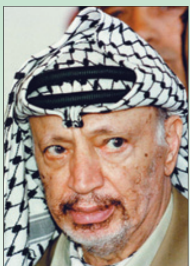
الرئيس الراحل ياسر عرفات

يحول دون إعادة البحث في هذا الموضوع بما في ذلك فحص رفاة الرئيس الراحل من قبل جهة علمية وطبية موثوقة وبناء على طلب وموافقة أفراد عائلته" . وأضاف أبو ردينة أن "القيادة الفلسطينية تعهدت بمتابعة موضوع أسباب مرض واستشهاد الرئيس الراحل، من أجل الوقوف على الحقيقة التي تقطع الشك باليقين بهذا الشأن، واتخاذ كافة الإجراءات لتابعته" . وشدد على أنه "ما زال استشهاد الرئيس الراحل يشغل الرأي العام الفلسطيني والعربي والعالم، لما له من أهمية قصوى، نابعة من أهمية باعث اسم فلسطين ورمزها وقائد نضال شعبها على امتداد أربعة عقود على طريق الحرية والاستقلال" . وأظهر تقرير قناة الجزيرة القطرية وجود أدلة بشأن العثور على مستويات عالية من مادة "البولونيوم" المشع والسام في مقتنيات شخصية لعرفات استعملها قبل فترة وجيزة من وفاته في تشرين الثاني/نوفمبر ٢٠٠٤ في ظروف غامضة . (التفاصيل: ص٣)