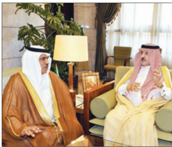
الأمير سطاتم مجتمعا إلى الجبير (و.أ.س)

الرياض - واس ■ أثنى صاحب السمو الملكي الأمير سطاتم بن عبدالعزيز أمير منطقة الرياض على الجهود التي تبذلها أمانة منطقة الرياض في توفير المشروعات البيئية والترفيهية التي أصبحت ضرورة ملحة للمدينة وسكانها والحرص على إنجاز المشروعات في الوقت المناسب والحرص على الدقة في التنفيذ لكي تظهر تلك المشروعات بما يليق بعاصمة المملكة العربية السعودية وإرضاء جميع شرائح المجتمع. جاء ذلك خلال اجتماع عقد بمكتب سموه في قصر الحكم امس لمناقشة مشروعات الحدائق الكبرى في مدينة الرياض . واستقبل الأمير سطاتم بن عبدالعزيز في مكتبه بقصر الحكم امس رئيس القطاع الأوسط في الشركة السعودية للكهرباء مساعد بن محمد الجبير . واستعرض رئيس القطاع الأوسط بالشركة السعودية للكهرباء خلال الاستقبال أعمال الشركة وإنجازاتها لهذا العام . (التفاصيل: ص٢)