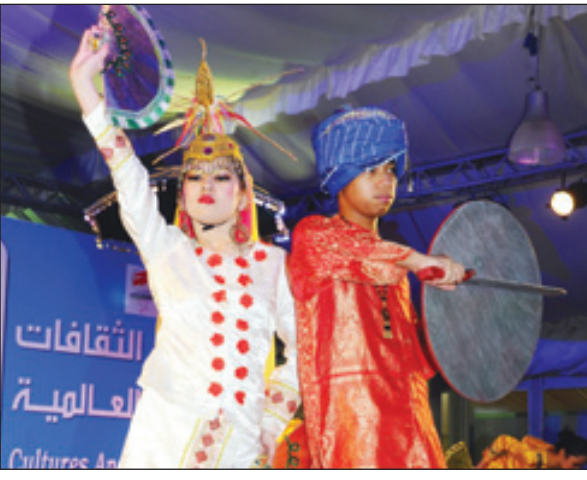
من افتتاح مهرجان الثقافات والسفرة العالمية