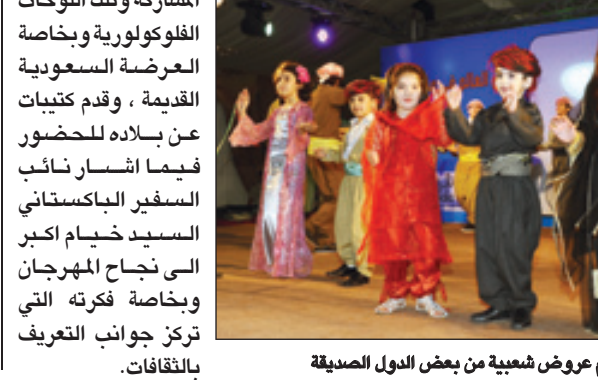
تقديم عروض شعبية من بعض الدول الصديقة

المدينة التاريخية الكبرى ومراحل تطورها. ويشترك في المهرجان العديد من سفارات الدول في المملكة وهي: مصر، والمغرب، والسودان، والأردن، ونونس، وسلطنة عمان، وليبيا، والجزائر، والكويت، والعراق، وأريتريا، والمجر، وبريطانيا، وفرنسا، وكوبا، وأمريكا، وإيطاليا، وباكستان، والصين، والكونغو، والفلين، وأسبانيا، ومدغشقر، ونيجيريا، واليونان. وتهدف الجمعية من إقامة المهرجان للتعريف بأحد أهم أنواع الإعاقة التي يصاب بها العديد من البشر وهو التوحد الذي أصبح من أكثر الأمراض انتشاراً في منطقة الشرق الأوسط وآسيا. فيما أبدى القائم بأعمال السفير الأمريكي توماس وليم بالسعودية سعادته القصوى وإنبهاره بحجم المشاركة وتلك اللوحات المفكوكولورية وبخاصة العرضة السعودية القديمة، وقدم تهنيتات عن ببلاده للضيوف، فيما أشاد نائب السفير الباكستاني السيد خيام أكبر إلى نجاح المهرجان وبخاصة فقرته التي تركز جوانب التعريف بالثقافات.