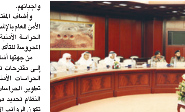
اللجنة الأمنية في أحد اجتماعاتها السابقة

وتلخصت مقترحات أمنية الغرف التجارية بإلزام جميع الجهات التي تحدها اللائحة بتوفير حراسات أمنية في الشركات والمؤسسات الأمنية المصرح لها فقط، وإمكانية السماح لها بتدريب الأفراد بمقراتهم أو إنشاء معهد تدريب متخصص، إضافة إلى وضع نظام خاص للزي الموحد للشركات والمؤسسات الأمنية المصرح لها، وأن تتضمن مستحقات الأفراد النظامية من تأمين طبي وتأمينات اجتماعية ومستحقات خدمية، وأهمية تفعيل ما تضمنته اللائحة من تسليح رجال الأمن وفق الضوابط المحددة باللائحة. وترى لجنة الحراسات الأمنية أن يتم وضع لائحة أخرى منظمة لعمليات نقل الأموال والمقتنيات الثمينة وتغذية الصرافات مع وضع الضمانات وتحديد الاختصاصات وكذلك رواتب ومستحقات العاملين.