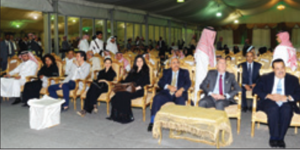
دبلوماسيون يشاركون بالتعرف على الأكلات الشعبية