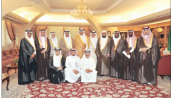
الأمير محمد بن فهد مستقبلاً الحويجي

ومن جهته أعرب أعضاء المجلس عن سعادتهم وشكرهم لصاحب السمو الملكي الأمير محمد بن فهد بن عبدالعزيز التي تقدم الخدمات المتنوعة لذوي الاحتياجات الخاصة وتوفير التعليم والصحة وجميع ما تحتاجه هذه الفئة لتتشارك في تنمية وبناء هذا الوطن، وحث سموه على تكثيف الجهود وبذل المزيد من الجهد لتقديم أفضل الخدمات لهذه الفئة الغالية علينا جميعاً في أرجاء هذا الوطن عموماً والمنطقة الشرقية خصوصاً.