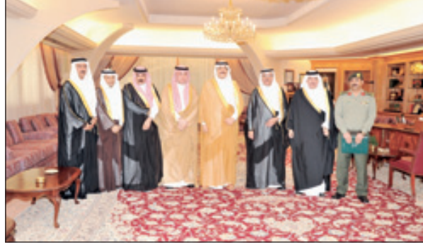
الأمير محمد بن فهد مستقبلاً العطيشان

كما استقبل سمو أمير المنطقة الشرقية في مكتبه الأستاذ خليل بن إبراهيم الحويجي رئيس مجلس إدارة نادي ذوي الاحتياجات الخاصة بمحافظة الأحساء وأعضاء المجلس، ورحب سموه بالضيوف، وأشاد سموه بما تحظى به هذه الفئة الغالية من ذوي الاحتياجات الخاصة من اهتمام في جميع نواحي الحياة، وتوفير كل ما يحقق لهم الراحة والمشاركة الفاعلة في مجتمعهم في ظل الدعم والاهتمام الكبير الذي توليه حكومة سيدي خادم الحرمين الشريفين الملك عبدالله بن عبدالعزيز وسمو سيدي ولي عهده