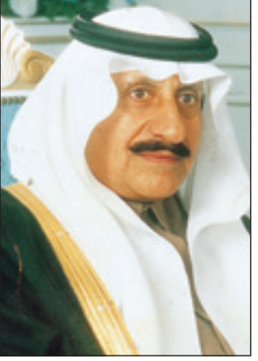
الأمير عبدالله بن عبدالعزيز بن مساعد