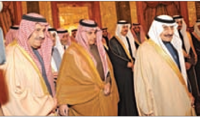
الملك يستقبل إخوة الأمير تركي بن سلطان والأمير فيصل بن خالد

الاستخبارات العامة الأمين العام لمجلس الأمن الوطني وصاحب السمو الملكي الأمير فيصل بن خالد بن عبدالعزيز أمير منطقة عسير وصاحب السمو الملكي الأمير فيصل بن سلطان بن عبدالعزيز الأمين العام لمؤسسة سلطان بن عبدالعزيز الخيرية وصاحب السمو الملكي الأمير سلمان بن سلطان بن عبدالعزيز مساعد الأمين العام لمجلس الأمن الوطني للشؤون الأمنية والاستخباراتية وصاحب السمو الملكي الأمير نايف بن سلطان بن عبدالعزيز المستشار في مكتب سمو وزير الدفاع وصاحب السمو الملكي الأمير بدر بن سلطان بن عبدالعزيز وصاحب السمو الملكي الأمير سعود بن سلطان بن عبدالعزيز وصاحب السمو الملكي الأمير أحمد بن سلطان بن عبدالعزيز وصاحب السمو الملكي الأمير نواف بن سلطان بن عبدالعزيز وصاحب السمو الملكي الأمير منصور بن سلطان بن عبدالعزيز وصاحب السمو الملكي الأمير عبدالله بن سلطان بن