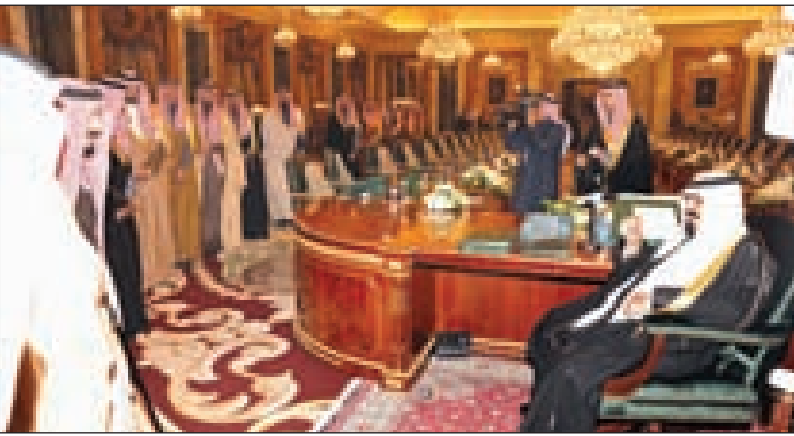
الملك عبدالله خلال استقباله أصحاب السمو الأمراء