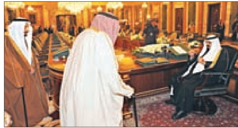
الملك يستقبل أصحاب السمو