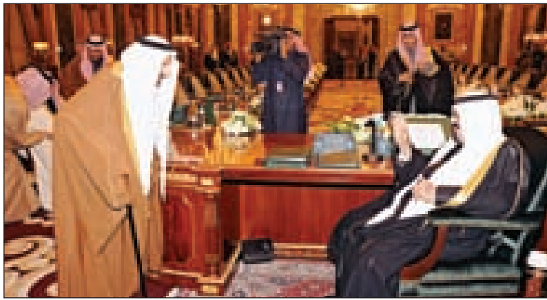
خادم الحرمين خلال استقباله الأمراء