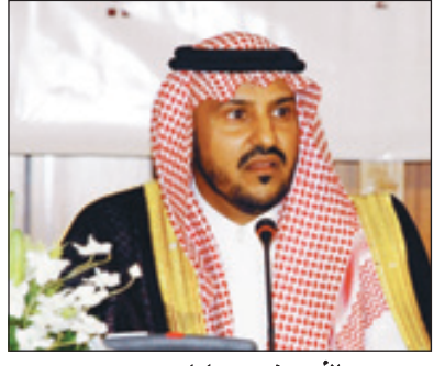
الأمير بندر بن سلمان بن محمد

وأثنى الدكتور أبا الخيل على جهود مستشار خادم الحرمين الشريفين رئيس لجنة الدعوة في أفريقيا صاحب السمو الأمير الدكتور بندر بن سلمان بن محمد آل سعود في خدمة الإسلام والمسلمين في القارة الأفريقية، سائلاً الله أن يجعل ذلك في ميزان حسنات سموه وأن يجعلها خاصة لوجه الله تعالى.