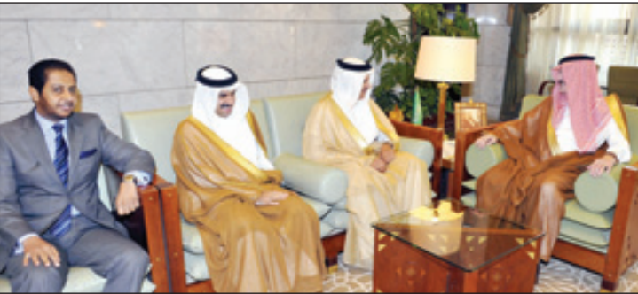
الأمير سطا م يستقبل شخصيات دبلوماسية