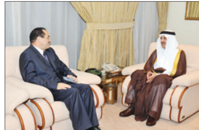
وزير الداخلية يستقبل السفير التونسي

الأمير أحمد بن عبدالعزيز، وأعرب عن شكره وتقديره لما تلقاه الجمهورية التونسية من دعم كبير من المملكة العربية السعودية. حضر المقابلة مدير عام مكتب سمو وزير الداخلية للدراسات والبحوث اللواء سعود بن صالح الداود. كما استقبل الأمير أحمد