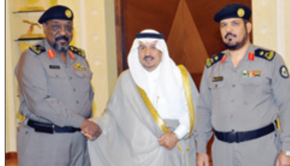
الأمير فيصل يقبل مدير دوريات الأمن رتبته الجديدة

خلال رعايته حفل تخريج ١٤٨ من حفاظ كتاب الله