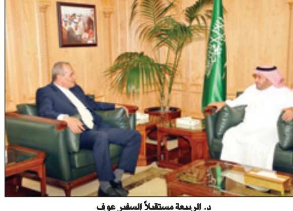
د. الربعة يستقبل السفير عوف

الرياض - محمد الحيدر استقبل وزير الصحة الدكتور عبدالله الربعة امس بمكتبه بديوان الوزارة سفير جمهورية مصر العربية الشقيقة لدى المملكة الأستاذ محمود محمد عوف الذي ودعه بمناسبة انتهاء فترة عمله سفيراً لبلاده لدى المملكة. وعبر السفير المصري عن شكره وتقديره لحكومة خادم الحرمين الشريفين الملك عبدالله بن عبدالعزيز، على الدعم الذي لقيه خلال فترة عمله. ونوه السفير عوف بالتعاون الصحي بين البلدين الشقيقين والتكامل البناء في هذا المجال وخاصة تأهيل الكوادر وبرامج التدريب وتبادل الخبرات.