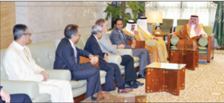
أمير الرياض يستقبل المهنيين

الرياض، واس استقبل صاحب السمو الملكي الأمير سطا م بن عبدالعزيز أمير منطقة الرياض في مكتب سموه بقصر الحكم أسس الأمين العام لمجلس التعاون لدول الخليج العربية الدكتور عبداللطيف بن راشد الزياتي، وعميد السلك الدبلوماسي المعتمد لدى المملكة سفير دولة قطر علي بن عبدالله آل محمود، يرافقه عمداء المجموعات العربية والأفريقية والآسيوية وأمريكا الشمالية والأوروبية والأطلسية وأمريكا الجنوبية الذين قدموا لسموه التهانئ بمناسبة حلول شهر رمضان المبارك.