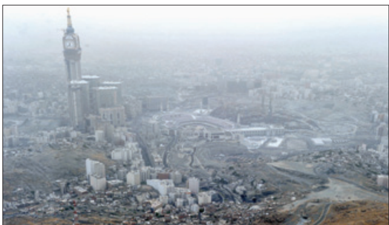
بيت الله الحرام أظهر بقعة على وجه البسيطة تعكف في حماه قمة التضامن الإسلامي