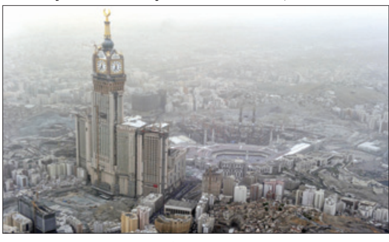
العاصمة المقدسة اختلفت كثيرا عن آخر قمة والقمة المقبلة