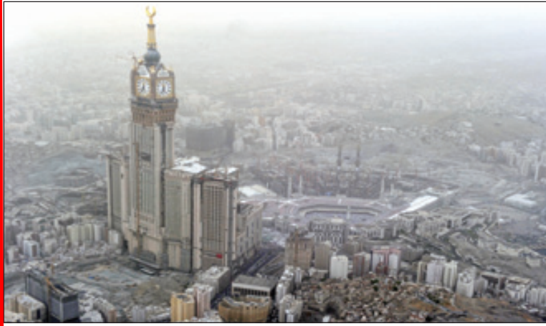
العاصمة المقدسة اختلفت كثيراً عن آخر قمة والقمة المقبلة

ويذكر الربيعي حامد البركاتي ذكريات خروج طلاب العاصمة المقدسة على طول المدخل المؤدي إلى الحرم المكي من أعلى جبل أجياد إلى الحرم المكي لتحية رؤساء وملوك وأمراء الدول الإسلامية وإشراف إدارة التربية في تظاهرة لم يعود عليها أبناء مكة المكرمة ولا زالت عالقة في ذاكرة المشاركين.