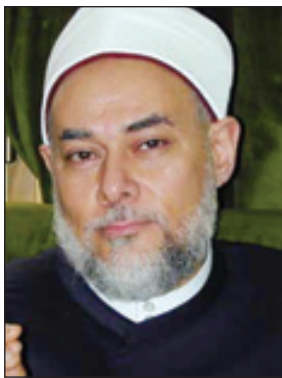
مفتي مصر الدكتور علي جمعة

الى رصيده الضخم من المبادرات التي أطلقها في السابق لعلاج هذه الجائحة، ويأتي في مقدمة هذه المبادرات مبادرته التاريخية للحوار بين الأديان والحضارات. أما الدكتور سيد البري الأمين العام لحزب البلد المصري فقد أكد أن دعوة خادم الحرمين الشريفين الملك عبد الله بن عبدالعزيز لعقد قمة إسلامية استثنائية في مكة المكرمة على هذه القمة وما ستتمخض عنه من قرارات تسهم رأب الصدع ومواجهة مختلف التحديات التي تواجهها أمتنا وفي مقدمتها الفرقة والخلاف والتطرف والإرهاب وتقضي مشكلات الفقر والبطالة في العالم الإسلامي. وأضاف أن مبادرة خادم الحرمين الشريفين الملك عبد الله بن عبدالعزيز لعقد هذه القمة يلقى لنا بطوق النجاة.