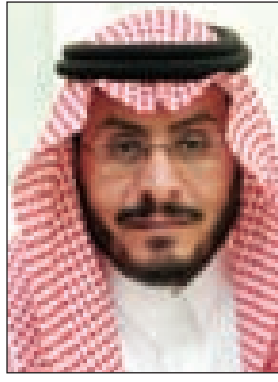
د. شويش الضويحي

الرياض-واس رفع وزير الإسكان الدكتور شويش بن سعود الضويحي التهاني والتبريكات إلى خادم الحرمين الشريفين الملك عبدالله بن عبدالعزيز آل سعود، وسمو ولي عهده الأمين -حفظهما الله- والشعب السعودي الكريم بمناسبة صدور ميزانية العام المالي 1434/1435هـ ميزانية الطموح والإنجاز، مُتمنياً ما حظيت به كل القطاعات والمؤسسات من دعم مستمر نحو الارتقاء بها في جميع مناطق المملكة. وقال في تصريح صحفي بهذه المناسبة: "إن هذه الميزانية تأتي لتصل العطاء بالعطاء والإنجاز بالإنجاز، في ظل الرؤية الطموحة لخادم الحرمين الشريفين، وسمو ولي عهده الأمين -حفظهما الله-، بتحقيق النهضة الشاملة في جميع المجالات، إذ شهدت المملكة في هذا العهد تطوراً نوعياً وتقدماً لافتاً جاء نتاجاً لمزيج معرفي اقتصادي، وجد ثمرته أبناء هذا الوطن الكريم، الذين هُبات لهم عوامل عدة تتحقق معها حياة كريمة، وما أدل على ذلك ما صدر مؤخراً من أوامر استفاد منها الوطن بمواطنيه وقطاعاته كافة، منها ما يُعنى بالتعليم وإتاحة الفرصة للابتعاث الخارجي، وتوفير مزيد من فرص العمل، والاهتمام بالقطاع الصحي للعمل على عدد من المدن الطبية في مناطق عدة، إضافة إلى ما حظي به قطاع الإسكان من حرص ودعم. واستبشر معاليه بما تحمله ميزانية هذا العام التي تعد ميزانية تاريخية، تأتي امتداداً لميزانيات تاريخية متتابعة بفضل الله، تعكس حجم التقدم الذي تشهده المملكة تنموياً واقتصادياً، تتواصل معها مسيرة النماء والعطاء بعون الله.