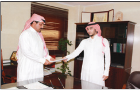
مدير شؤون الموظفين مرحباً بأحد الموظفين