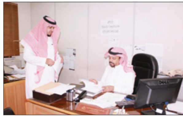
قسم خدمة الموظف

عبروا عن فرحتهم وامتنانهم .. عدد من الموظفين ممن تم ترسيمهم :