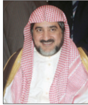
الشيخ صالح آل الشيخ

أتمتت وزارة الشؤون الإسلامية والأوقاف والدعوة والإرشاد عملية تثبيت الموظفين المؤقتي، وأصدرت قرارات تعيينهم، إنفاذا للتوجيه السامي الكريم المبارك القاضي بتثبيت شاغلي الوظائف المؤقتة والعاملين على لائحة المستخدمين، ولائحة بند الأجور، وغلل الأوقاف . وبهذه المناسبة ، رفع معالي الوزير الشيخ صالح بن عبدالعزيز آل الشيخ أصالة عن نفسه، ونيابة عن الموظفين المنتخبين، جزيل الشكر ، وعظيم التقدير، وصادق الدعاء لمقام خادم الحرمين الشريفين الملك عبدالله بن عبدالعزيز . حفظه الله ورعاه .. وأبان معاليه أن هذه المكرمة المكرمة ليست مستغربة عن