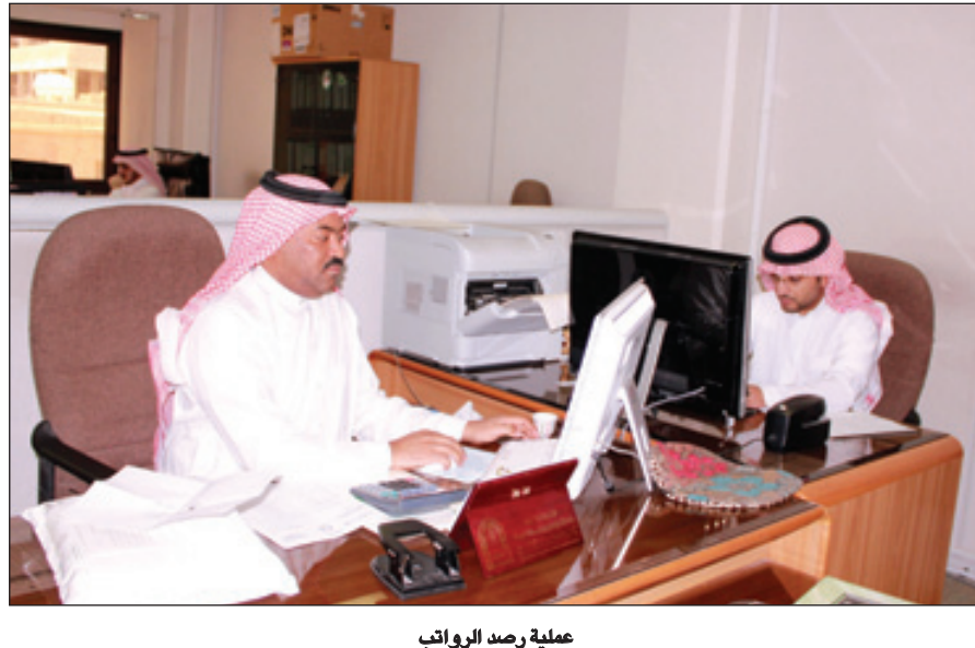
عملية رصد الرواتب