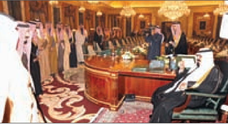
الملك عبدالله خلال استقباله أصحاب السمو الأمراء