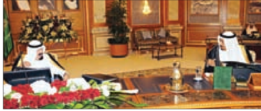
خادم الحرمين مترسماً مجلس الوزراء

ورأس خادم الحرمين الجلسة التي عقدها مجلس الوزراء مساء أمس الإثنين في قصر السلام بجدة و أعرب المجلس عن تقديره الكبير لما يوليه خادم الحرمين من اهتمام وحرص شديد على كل ما فيه خدمة الإسلام والمسلمين وحثهم، مؤكدا في هذا الشأن أن دعوة الملك عبدالله إلى مؤتمر التضامن الإسلامي الاستثنائي في مكة المكرمة يجسد هذا الحرص على الأمة الإسلامية في هذا الوقت الدقيق والمخاطر التي تواجهها