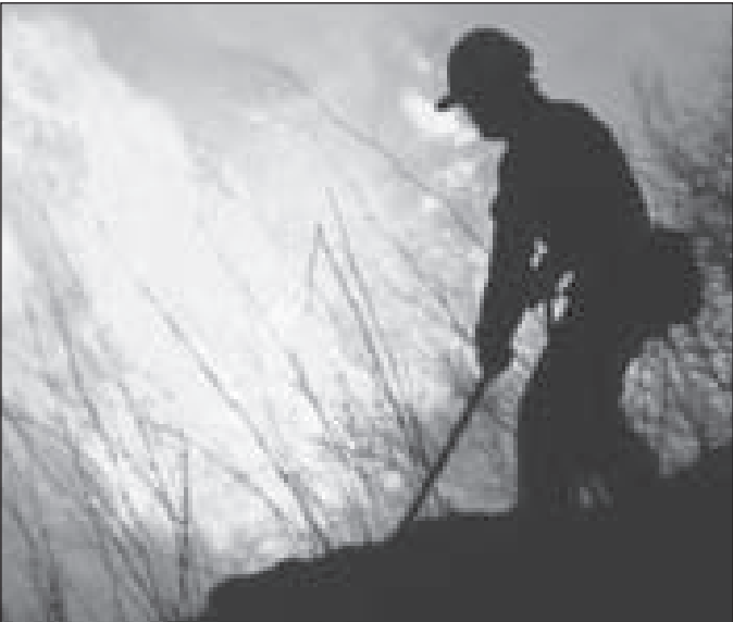
إطالفي فرنسي يسعى إلى الحد من تقدم النيران