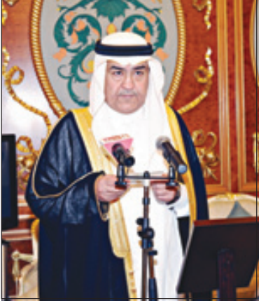
السفير هشام بن سلطان القحطاني المعين لدى البرازيل يتشرف بأداء القسم