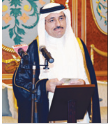
السفير سعيد حسن الجمع المعين لدى كويا يتشرف بأداء القسم

جدة، واس تشرف بأداء القسم أمام خادم الحرمين الشريفين الملك عبدالله بن عبدالعزيز آل سعود حفظه الله أمس في قصر السلام عدد من سفرائه المعينين لدى عدد من الدول الصديقة وهم السفير هشام بن سلطان بن ظافر القحطاني المعين لدى جمهورية البرازيل والسفير عدنان بن عبد الرحمن بن عبدالله المنذيل المعين لدى جمهورية الغابون والسفير سعيد بن حسن الجمع المعين لدى جمهورية كويا قائلاً: «أقسم بالله العظيم أن أكون مخلصاً لديني ثم لمليكي ووطنى وأن لا أبوح بسر من أسرار الدولة وأن أحافظ على مصالحها وأنظمتها في الداخل والخارج وأن أؤدي عملي بالصدق والأمانة والإخلاص». عقب ذلك تشرف السفراء بالسلام على خادم الحرمين الشريفين الذي دعا الله سبحانه وتعالى لهم بالتوفيق وهنأهم بهذه المناسبة وحملهم تحياته وتقديره لقيادة الدول المعينين لديها. وقال حفظه الله: لا أرى أن يكون عندكم أو لا إحساس بانكم تمثلون المملكة العربية السعودية وشعب المملكة العربية