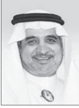
د. عبدالله مهرجي

وأضاف: نحن كشعب ومسؤولين نحمد الله عز وجل على مناحق من إنجازات ضخمة يشهدها القاصي قبل الداني ونسعى جميعاً للمحافظة على هذه المكتسبات واستثمارها والعمل على تطويرها لصالح أبناء هذا الوطن المعطاء وأن جامعة المؤسس والتي تعد أكبر جامعة سعودية من حيث عدد الطلاب تعمل جاهدة نحو الارتقاء بالعملية التعليمية وضبط الجودة وتحقيق التميز ضمن منظومة التعليم العالي التي يقودها بكل اقتدار الدكتور خالد بن محمد العنقري ويتوجبه ورؤية من مدير الجامعة الأستاذ الدكتور أسامة بن صادق طيب الذي دائماً ما يؤكد على مسؤولية الجامعة العلمية والبحثية وخدمة المجتمع والمشاركة بفعالية في تحقيق هدف وشعار صاحب السمو الملكي الأمير خالد الفيصل أمير منطقة مكة المكرمة للوصول نحو العالم الأول من خلال بناء الإنسان وتنمية المكان. وشكر الدكتور مهرجي في ختام تصريحه معالي وزير التعليم العالي ومعالي مدير الجامعة على حسن ثقتهما ودعمهما المستمر للكفاءات العلمية السعودية.