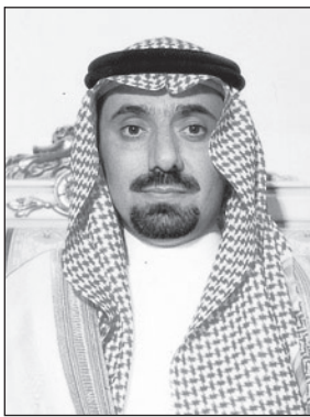
الأمير جلوي بن عبد العزيز

الأحساء - سوسن الحواج هنأ صاحب السمو الأمير جلوي بن عبد العزيز بن مساعد نائب أمير المنطقة الشرقية نائب رئيس مجلس المنطقة أمانة الأحساء بمناسبة حصولها على درجة (الإنجاز المتميز) لبرنامج التعاملات الإلكترونية الحكومية (يسر) الذي يعد أعلى سلطة قياس بالتعاملات الإلكترونية الحكومية بالمملكة بالتعاون مع فريق من جامعة الملك فهد للبترول والمعادن. وحصلت أمانة الأحساء على نسبة ٩٠٪ بمستوى التحول الإلكتروني بالمرحلة الثانية (الإتاحة) الأمر الذي منحها أحقية في الانتقال للمرحلة اللاحقة وهي مرحلة التميز والتحسين التي تهدف إلى الارتقاء بحصولهم على العديد من شهادات التقدير