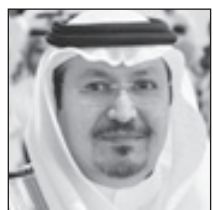
د. محمد الشمrani

الطائف - هلال الحازني أرجأت إدارة التربية والتعليم بمحافظة الطائف إعلان حركة النقل الداخلية للمعلمين والمعلمات حتى صدور حركة النقل الخارجية المرتقبة، والتي تعتمد وزارة التربية والتعليم إجراءاتها خلال الفترة القادمة. وقال مدير عام التربية والتعليم بمحافظة الطائف، الدكتور محمد بن حسن الشمrani إن إدارته أرجأت إعلان الحركة الداخلية لمعلمي ومعلمات محافظة الطائف إلى حين صدور حركة النقل الخارجية المرتقبة، وذلك مراعاة للمعلمين والمعلمات المتوقع نقلهم خارجياً من وإلى الطائف. وأشار الدكتور الشمrani إلى أنه ستكون مباشرة المعلمين المنقولين في الحركة الداخلية في مدارسهم الجديدة بداية عودة المعلمين والمعلمات بعد عيد الفطر المبارك بعد استلام خطابات التوجيه من مكاتب التربية والتعليم التابعين لها. وكان من المتوقع إعلان الحركة الداخلية لمعلمي ومعلمات قبل تمتعهم بالإجازة لمعرفة مدارسهم الجديدة المنقولين إليها إلا أن الإدارة أعلنت تأجيلها إلى وقت لاحق.