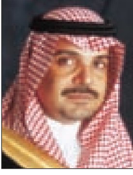
الأمير عبدالعزيز بن ماجد

المدينة المنورة - سالم الأحمدى نوه صاحب السمو الملكي الأمير عبدالعزيز بن ماجد بن عبدالعزيز أمير منطقة المدينة المنورة بحرص خادم الحرمين الشريفين الملك عبدالله بن عبدالعزيز آل سعود وسمو ولي عهده الأمين -حفظهما الله- على رفع مستوى الإنفاق على المشاريع التنموية التي تخدم المواطن مباشرة، وتستهدف توفير العيش الكريم لأبناء الوطن في مناطق المملكة كافة. وعد سموه الأرقام القياسية