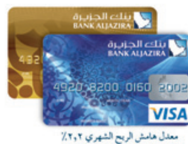
معدل هامش الربح الشهري ٢,٢٪

*قط لخاملي بطاقة الجزيرة الدعية الائتمانية