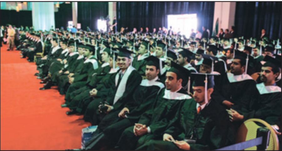
جانب من حفل تخرج الملحقية العام الماضي

واختلقت مشاعر الخريجين في هذه المناسبة بالحب والشكر