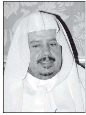
رئيس مجلس الشورى

الرياض- محمد الشيباني رفع مجلس الشورى التهاني لخادم الحرمين الشريفين الملك عبدالله بن عبدالعزيز آل سعود ولصاحب السمو الملكي الأمير سلمان بن عبدالعزيز آل سعود ولي العهد نائب رئيس مجلس الوزراء وزير الدفاع - حفظهما الله - بمناسبة صدور الميزانية العامة للدولة للعام المالي الجديد ١٤٣٥/١٤٣٤هـ، وجاء ذلك في مستهل أعمال الجلسة العادية السابعة والسبعين التي عقدت امس الأحد برئاسة رئيس المجلس الشيخ الدكتور عبدالله بن محمد بن إبراهيم آل الشيخ، وثمن المجلس في بيان تلاه الأمين العام الدكتور محمد بن عبدالله آل عمرو ما حملته هذه الميزانية التاريخية من أرقام قياسية وما تضمنته من مؤشرات ودلالات على استمرار حكومة خادم الحرمين الشريفين في نهجها التنموي في مختلف المجالات وبخاصة في مجالات التعليم والصحة والنقل والتنمية الاجتماعية.