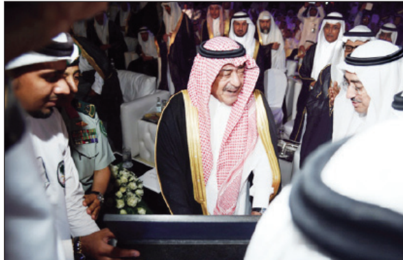
الأمير مقرن خلال وضعه الحجر الأساس

جدة - سعد بن عبدالله ■ نيابة عن خادم الحرمين الشريفين قام صاحب السمو الملكي الأمير مقرن بن عبدالعزيز النائب الثاني لرئيس مجلس الوزراء المستشار والمبعوث الخاص لخادم الحرمين الشريفين بوضع الحجر الأساس لمشروع إنشاء مستشفى الملك فيصل التخصصي ومركز الأبحاث في موقعه الجديد شمالي جدة مساء أمس.