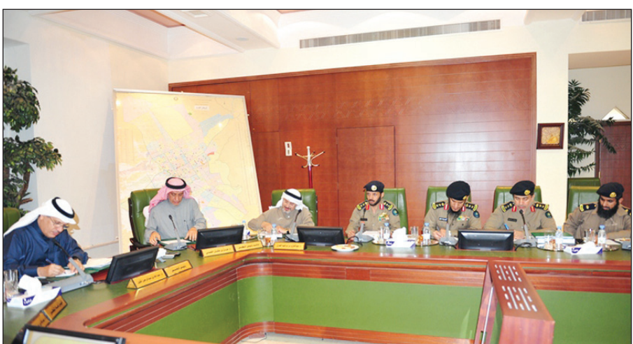
المهندس المقبل في نقاش مع رجال الدفاع المدني