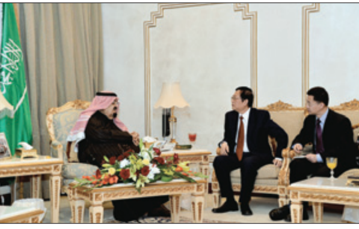
الأمير مشعل لدى لقائه السفير الصيني

استقبل صاحب السمو الملكي الأمير مشعل بن عبدالعزيز رئيس هيئة البيعة في منزله سموه بالرياض أمس، السفير الصيني لدى المملكة لي تشنغ ون الذي قدم لزيارة سموه والسلام عليه. وجرى خلال اللقاء تبادل الأحاديث الودية والمواضيع المشتركة بين البلدين. وفي ختام اللقاء قدم السفير الصيني لسمو