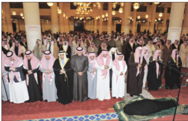
الأمير محمد بن سعد يؤدي الصلاة على الفقيدة

بن عبدالعزيز قائد القوات البرية الملكية السعودية وصاحب السمو الملكي الأمير نهار بن سعود بن عبدالعزيز وصاحب السمو الأمير فواز بن عبدالله بن عبدالرحمن وصاحب السمو الأمير أحمد بن عبدالله بن عبدالرحمن محافظ الدرعية وصاحب السمو الأمير عبدالعزيز بن عبدالله بن عبدالرحمن وصاحب السمو الأمير سلمان بن عبدالله بن عبدالرحمن وعدد من أصحاب السمو الملكي الأمراء. كما أدى الصلاة مع سموه أبناء الفقيدة وهم صاحب السمو الملكي الأمير عبدالعزيز بن سعود بن ناصر بن عبدالعزيز وصاحب السمو الملكي الأمير خالد بن سعود بن ناصر بن عبدالعزيز وعدد من المسؤولين وجمع من المواطنين.