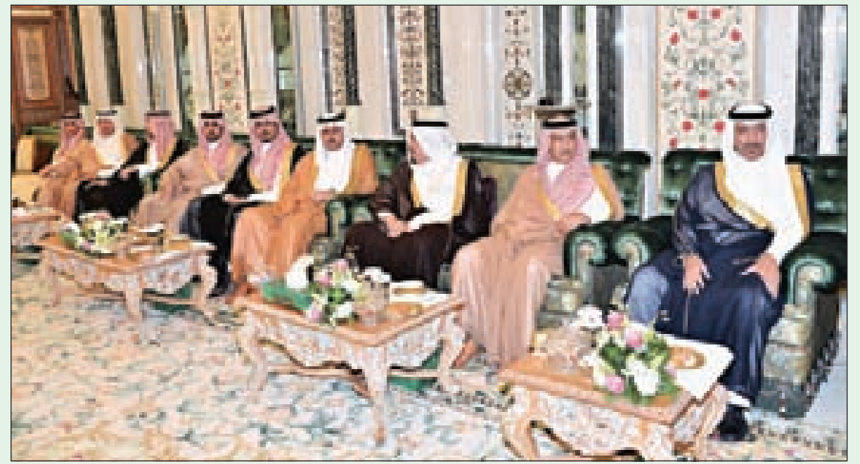
أصحاب السمو الملكي الأمراء خلال الاستقبال