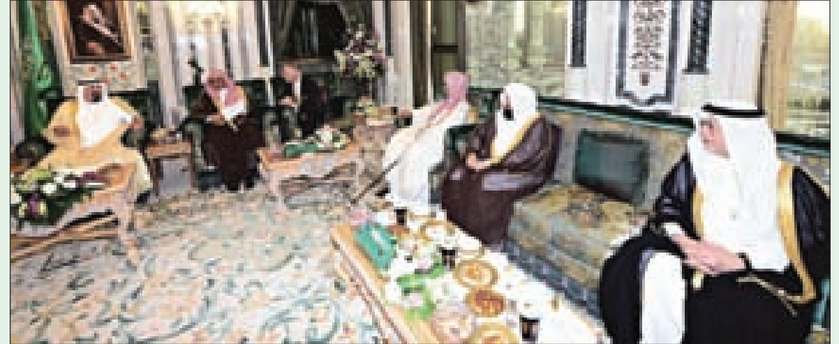
الملك عبدالله خلال الاستقبال