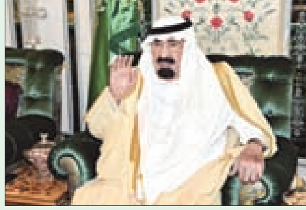
خادم الحرمين خلال الاستقبال