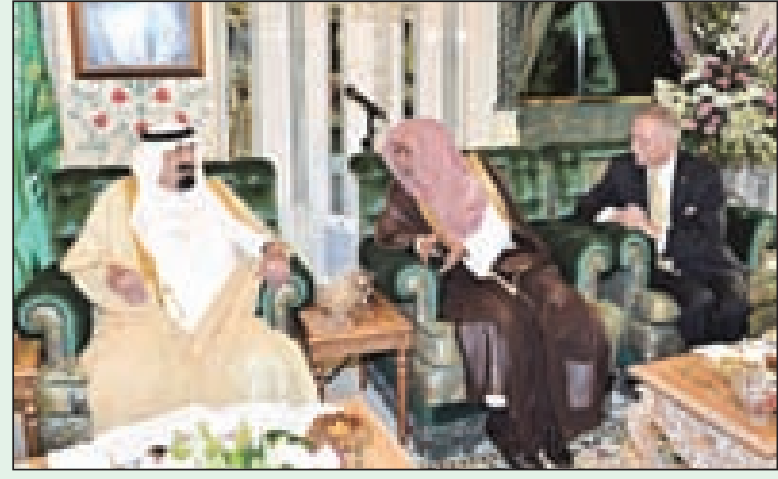
خادم الحرمين في حديث مع الشيخ ابن حميد والبروفيسور أوغلي

مكة المكرمة - واس ■ استقبل خادم الحرمين الشريفين الملك عبدالله بن عبدالعزيز آل سعود - حفظه الله - في قصر الصفا قبل مغرب أمس معالي الأمين العام لمنظمة التعاون الإسلامي البروفيسور أكمل الدين أوغلي. كما استقبل - أيده الله - معالي وزير الحج الدكتور بندر بن محمد حجار ومسؤولي وزارة الحج ورؤساء المؤسسات الأهلية لأرباب الطوافة والأدلاء والوكلاء والنقابة العامة للسيارات.