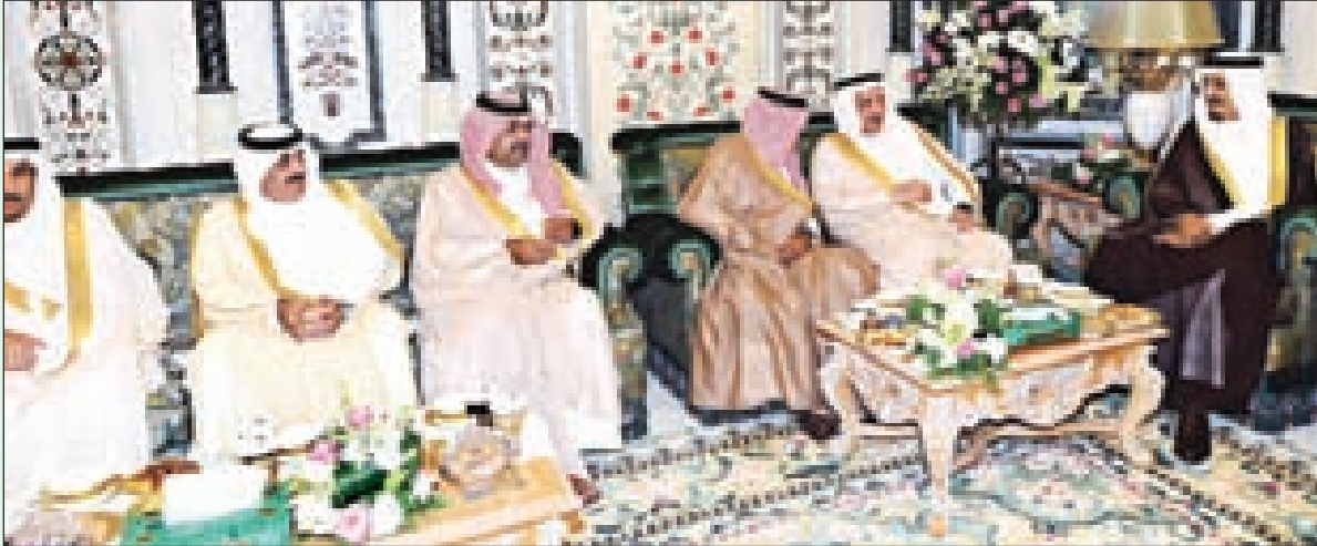
ولي العهد والأمير عبدالله والأمير مقرن والأمير فيصل بن عبدالله والأمير متعب بن عبدالله والأمير سعود بن نزيان

واستقبل خادم الحرمين الشريفين - رعاه الله - أعضاء اللجنة الرئاسية لمركز الملك عبدالعزيز للحوار الوطني وهم معالي نائب رئيس اللجنة الرئاسية الدكتور عبدالله بن عمر نصيف، ومعالي نائب رئيس اللجنة الرئاسية الشيخ راشد الراجح الشريف، ومعالي عضو اللجنة الرئاسية الدكتور عبدالله بن صالح العبيد، ومعالي مستشار خادم الحرمين الشريفين الأمين العام لمركز الملك عبدالعزيز للحوار الوطني الأستاذ فيصل بن عبدالرحمن بن