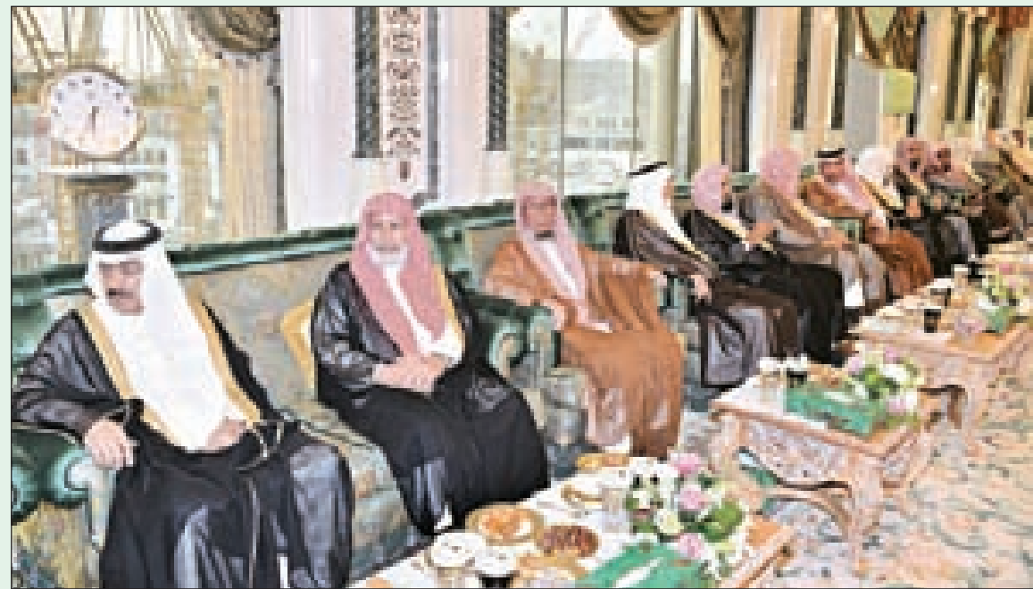
مسؤولو الحج ورئاسة الحوار ومركز الحوار