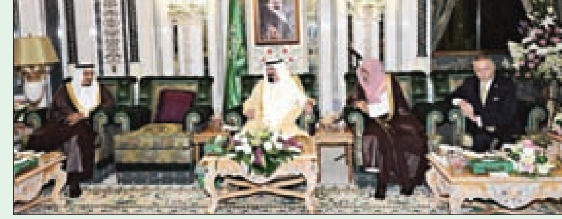
الملك عبدالله والأمير سلمان خلال الاستقبال