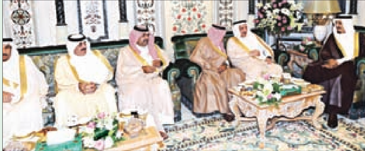
ولي العهد والأمير عبدالله والأمير مقرن والأمير فيصل بن عبدالله والأمير سعود بن نزيان

واستقبل خادم الحرمين الشريفين - رعاه الله - أعضاء اللجنة الرئاسية لمركز الملك عبدالعزيز للحوار الوطني وهم معالي نائب رئيس اللجنة الرئاسية الدكتور عبدالله بن عمر نصيف، ومعالي نائب رئيس اللجنة الرئاسية الشيخ راشد الراجح الشريف، ومعالي عضو اللجنة الرئاسية الدكتور عبدالله بن صالح العبيد، ومعالي مستشار خادم الحرمين الشريفين الأمين العام لمركز الملك عبدالعزيز للحوار الوطني الأستاذ فيصل بن عبدالرحمن بن