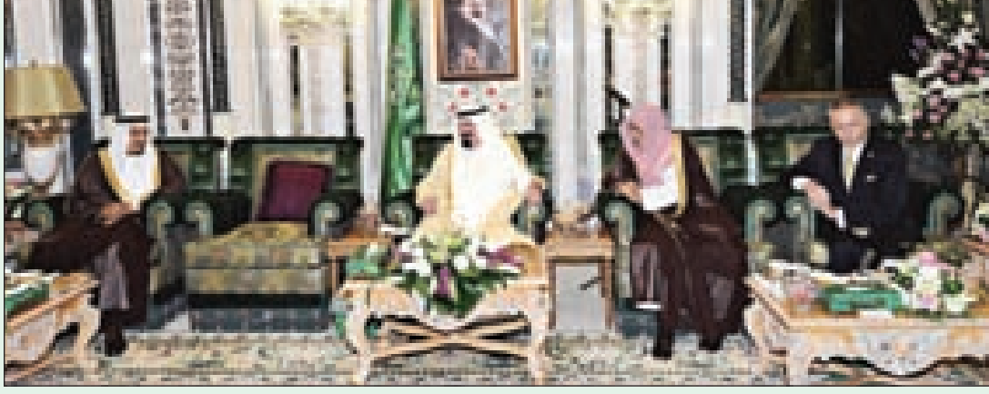
الملك عبدالله والأمير سلمان خلال الاستقبال