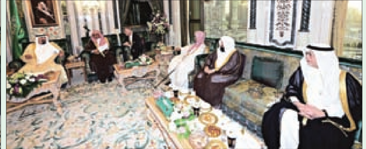
الملك عبدالله خلال الاستقبال