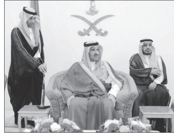
الأمير فيصل بن سلمان لدى وصوله العلا

وأقيم حفل خطابي بهذه المناسبة بدأ بتلاوة آيات من الذكر الحكيم، تلا ذلك كلمة أهالي المحافظة القاها إبراهيم بن سليمان القاضي رحب فيها بسمو أمير المنطقة ورفع فيها أعرق معاني الشكر والامتنان لخادم الحرمين الشريفين الملك عبدالله بن عبدالعزيز آل سعود وسمو ولي عهده الأمين - حفظهما الله - لما يوليانه من رعاية وعناية فائقة بكافة مناطق المملكة ومحافظاتها، كما هنا الأمير فيصل بن سلمان على الثقة الملكية بتعيينه أميراً لمنطقة المدينة المنورة، سائلاً الله العلي القدير أن يمد سموه بعونه وتوفيقه في خدمة مدينة الرسول صلى الله عليه وسلم. وعبر سمو أمير المنطقة عن تقديره للجميع لما أبدوه من مشاعر صادقة.