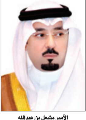
الأمير مشعل بن عبدالله

في أرجائها، التي جعلت جدة من أكبر المدن العالمية". مضيفاً سموه أن هذا القرار ويمشيه الله سيسهم في دعم المشروعات العملاقة وسيكون رافداً للهمم والعلم وأهله. وأشار سمو محافظ جدة إلى ما يحظى به أبناء الوطن الغالي من رعاية ودعم للتفوق العلمي لمجالاته كافة مما سيسهم في تطور بناء هذا الوطن الكبير المعطاء، سائلاً الله تعالى أن يحفظ خادم الحرمين الشريفين نخرال لهذه الأمة.