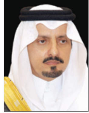
الأمير فيصل بن خالد

رفع صاحب السمو الملكي الأمير فيصل بن خالد بن عبدالعزيز أمير منطقة عسير بالبحر الشكر لخادم الحرمين الشريفين الملك عبدالله بن عبدالعزيز آل سعود - حفظه الله - بمناسبة صدور أمره الكريم بتحويل فرع جامعة الملك خالد في محافظة بيشة والمحافظات المجاورة إلى جامعة مستقلة تسمى "جامعة بيشة". وقال سموه في برقية رفعها لخادم الحرمين الشريفين أيده الله "يشرفني باسمي وباسم أبائناكم أهالي منطقة عسير أن أرفع لل مقام الكريم أصدق عبارات الشكر والتقدير والعرفان بمناسبة صدور أمركم الكريم بتحويل فرع جامعة