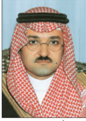
الأمير مشعل بن ماجد

أكد مدير جامعة الملك عبدالعزيز الدكتور أسامة طيب أن قرار تحويل فرع جامعة الملك عبدالعزيز بشمال جدة إلى جامعة مستقلة تحت مسمى جامعة جدة كان منظوراً وبعث الفخر والاعتزاز، وهذا ليس بغريب على ولاة أمورنا بقيادة خادم الحرمين الشريفين الملك عبدالله بن عبدالعزيز آل سعود - حفظه الله -. وقال معاليه في تصريح لوكالة الأنباء السعودية بهذه المناسبة: إن خادم الحرمين الشريفين الملك عبدالله بن العزيز آل سعود -أيده الله- أراد للمملكة تعليماً عالي المستوى معمماً على جميع مناطق المملكة في