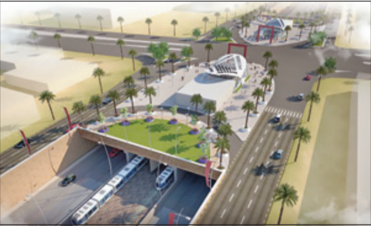
مترو الرياض أكبر مشروع لشبكات النقل العام في العالم يجري تطويره حالياً

وطالباتها من وإلى الجامعة بطريقة سريعة وأمنة بدلاً من التنقل بواسطة السيارات الخاصة أو سيارات الأجرة كما هو قائم حالياً، حيث سيتم ربط (مترو الجامعة الداخلي) بمسار القطار على طريق المطار، الذي يلتقي بدوره بثلاثة مسارات أخرى رئيسية من شبكة القطار في مركز الملك عبدالله المالي، تنفرع إلى أجزاء عدة من المدينة، وفي السياق ذاته، ستغطي شبكة النقل بالحافلات ضمن المشروع، والتي تتكون من ٢٤ مساراً، وتمتد لـ ١٠٨٣ كم، كامل أجزاء المدينة، جميع المدن الجامعية الحكومية والأهلية في الرياض، حيث تتوزع شبكة الحافلات بين ٤ مستويات مختلفة، بما يعزز دورها كرافد رئيسي لشبكة القطارات، ووظيفتها كناقل رئيسي للركاب ضمن الأحياء وعبر المدينة، وبما يحقق التكامل مع شبكة القطارات، ويساعد في الربط بين مراكز التعليم والتوظيف والمراكز التجارية بالأحياء، وتتوزع مستويات شبكة الحافلات بين كل من خطوط الحافلات ذات المسار المخصص، وخطوط الحافلات الدائرية، وخطوط الحافلات العادية، وخطوط الحافلات المغذية داخل الأحياء.