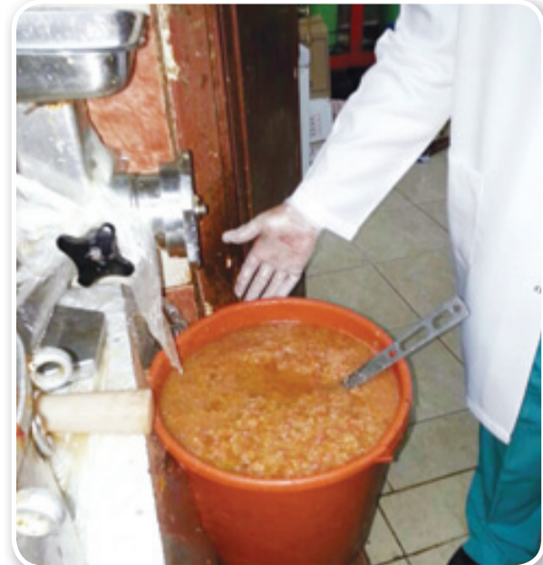
الإغلاق عقوبة مخالفي السلامة والأنظمة

وسجلت الفرق الميدانية بالأمانة خلال الحملة الرقابية المفاجئة أكثر من (٢٦٧) زيارة ميدانية لعدد من المحلات التجارية، كما تم إغلاق (٣٢) منشأة مخالفة لأسباب متنوعة منها عدم وجود تراخيص مهنية وانتهائها، وسوء النظافة داخل تلك المحلات، ووجود حشرات، وكذلك سوء تخزين الأغذية، ووجود مواد غذائية منتهية الصلاحية يتم تقديمها للمستهلكين تم ضبطها داخل المحلات. ونجح مراقبو الأمانة في مصادرة (٦٤٠) كيلو جراماً من اللحوم والأسماك والدواجن المتنوعة مجهولة المصدر التي لا تصلح للاستهلاك الأدمي، إضافة إلى مصادرة (٥٢٨) قطعة من الاواني والادوات غير الصالحة للاستخدام.