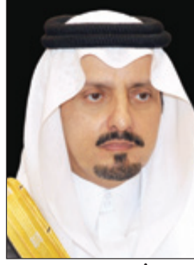
الأمير فيصل بن خالد

الملك خالد في محافظة بيشة والمحافظات المجاورة إلى جامعة مستقلة". وأضاف سموه يقول يسرني ويشرفني أن أعبر لكم عن مشاعر أبنائكم أهالي منطقة عسير تجاه هذا الأمر الكريم الذي جاء امتداداً لحرصكم على نشر العلم والمعرفة لكل شبر من هذا الوطن الغالي، وما سيكون لذلك من أثر ملموس في تنمية إنسان ومكان هذا الجزء الغالي من وطننا الحبيب، وهو بلا شك يعد تأكيداً على امتداد عهد الرخاء والتنمية في ظل قيادتكم الحكيمة، راجين من المولى العلي القدير أن يديم على بلادنا نعمه الظاهرة والباطنة لمواصلة مسيرة البناء لهذا الوطن المعطاء.