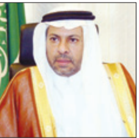
السفير عبد العزيز الغدير

السفير الغدير لـ «الرياض»: زيارة ولي العهد لباكستان ستعطي دفعة لتعزيز العلاقات