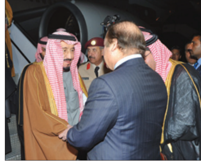
ولي العهد لدى وصوله إسلام آباد مستقبلاً من رئيس وزراء باكستان