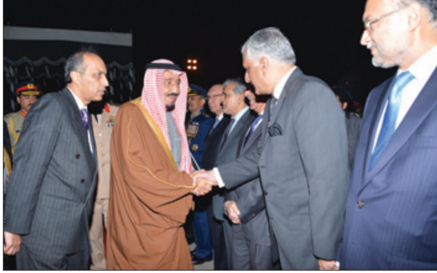
سمو مصافح كبار مستقبليه