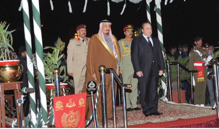
عزف السلامين الوطنيين السعودي والباكستاني