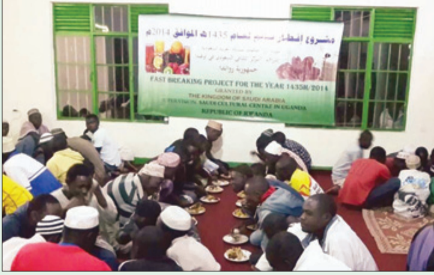
المسلمون في الخارج خلال افطارهم على مائدة خادم الحرمين الشريفين