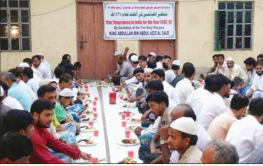
المسلمون في الخارج خلال افطارهم على مائدة خادم الحرمين الشريفين