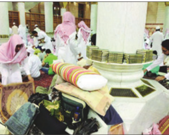
ممارسات خاطئة من العام الماضي يأمل مدير الابواب ان لا تتكرر هذا العام