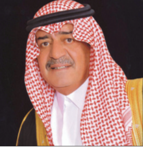
الأمير مقرن بن عبدالعزيز

جدة - واس بعث صاحب السمو الملكي الأمير مقرن بن عبدالعزيز آل سعود ولي ولي العهد النائب الثاني لرئيس مجلس الوزراء المستشار والمبعوث الخاص لخادم الحرمين الشريفين برفقة عزاء ومواساة لرئيس تحرير صحيفة الوطن طلال آل الشيخ في وفاة عمه الشيخ عبدالله بن عمر آل الشيخ رحمه الله. وقال سموه: "علمنا نبأ وفاة عمك الشيخ عبدالله بن عمر آل الشيخ - رحمه الله - وكترنا ذلك وإننا إذ نعرب لكم، وإخوان وأبناء الفقيد ولأسترتكم الكريمة عن أحر تعازينا وصادق مواساتنا، لنسال المولى القدير أن يتغمد الفقيد بواسع رحمته ويسكنه فسيح جناته، ويلهمكم الصبر والسلوان.. "إنا لله وإنا إليه راجعون".