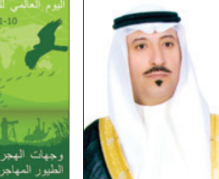
الأمير بندر بن سعود