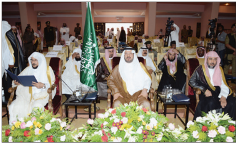
الأمير سعود بن عبدالمحسن راعياً لافتتاح الدورات وإلى جواره الشيخ د.عبداللطيف آل الشيخ

حائل - خالد العميم دشّن صاحب السمو الملكي الأمير سعود بن عبدالعزيز أمير منطقة حائل أمس الاول دورات (تفعيل دور عضو هيئة الأمر بالمعروف والنهي عن المنكر في تعزيز الأمن الفكري) بحضور الرئيس العام لهيئة الأمر بالمعروف والنهي عن المنكر الشيخ الدكتور عبداللطيف بن عبدالعزيز آل الشيخ وعدد من المسؤولين في المنطقة وذلك بقاعة فينيسيا بحائل. وبدئ الحفل الذي أقيم بهذه المناسبة بتلاوة آيات من الذكر الحكيم بعدها شاهد سموه والحضور عرضاً مرئياً من إعداد وحدة الأمن الفكري برئاسة العامة لهيئة الأمر بالمعروف والنهي عن المنكر عن دورات الأمن الفكري وأهدافها ومحاورها وأهم أنشطة وحدة الأمن الفكري. بعد ذلك ألقى الشيخ الدكتور عبداللطيف بن عبدالعزيز آل الشيخ كلمة أعرب فيها عن الشكر لسمو أمير منطقة حائل على تشييده هذه الدورات التي تعنى بتعزيز الأمن الفكري من خلال الطرح العلمي الشرعي الذي يعنى عناية تامة بالمحافظة على الفكر، مؤكداً أن الأمن الفكري هو الأمن الأساس لتحقيق الأمن العام للجميع من خلال العلم الشرعي وتحصين النشء من الوقوع في