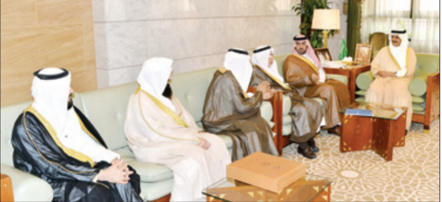
أمير الرياض مستقبلاً رئيس وأعضاء المجلس بحضور الأمير تركي بن عبدالله

الرياض - واس استقبل صاحب السمو الملكي الأمير خالد بن بندر بن عبدالعزيز أمير منطقة الرياض، بحضور صاحب السمو الملكي الأمير تركي بن عبدالله بن عبدالعزيز نائب أمير المنطقة، بقصر الحكم أمس، رئيس مجلس إدارة الغرفة التجارية الصناعية بالرياض الدكتور عبدالرحمن الزامل، وأعضاء مجلس الأوقاف بالغرفة التجارية، واستمع أمير الرياض ونائبيه، إلى إيجاز عن أهداف لجنة الأوقاف، التي تسهم في تطوير البيئة التشريعية والتنظيمية والوقفية، وتشجيع الأوقاف والعناية بها لدعم استراتيجيتها في تنمية موارد الأعمال الخيرية، وتهدف أيضاً إلى العناية بالكوادر العاملة في مجال الأوقاف وخدمة منتسبي الغرفة بتقديم الاستشارات في المجال ذاته. واستعرض الدكتور الزامل عدداً من الإنجازات التي تحققت من خلال عمل لجنة الأوقاف بالغرفة التجارية. وأشاد سمو أمير منطقة الرياض بالدور الذي تقوم به اللجنة وأنشطتها، مؤكداً أهمية الأهداف التي قامت من شأنها.