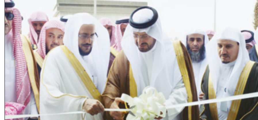
الأمير سعود بن عبدالمحسن خلال افتتاحه المبنى

الرياض - مناهي الشيباني دشّن صاحب السمو الملكي الأمير سعود بن عبدالعزيز أمير منطقة حائل ظهر الأربعاء مبنى فرع الرئاسة العامة لهيئة الأمر بالمعروف والنهي عن المنكر بمنطقة حائل، بحضور الرئيس العام لهيئة الأمر بالمعروف والنهي عن المنكر الشيخ الدكتور عبداللطيف بن عبدالعزيز آل الشيخ وأصحاب الفضيلة وكلاء الرئاسة. وقد قام سموه بقص الشريط إيداناً بافتتاح الفرع، ثم تجول سموه يرافقه الرئيس العام لهيئة الأمر بالمعروف والنهي عن المنكر، واستمع إلى شرح مفصل من مدير عام فرع الرئاسة بالمنطقة الشيخ معقود الحاربي، عن مبنى الرئاسة وما يحويه من إدارات وما يتميز به من تقنيات حديثة، تساهم في سرعة التواصل بين الفرع والرئاسة، لتقوم الهيئة بمهامها في خدمة المواطنين والمقيمين في هذه البلاد المباركة.