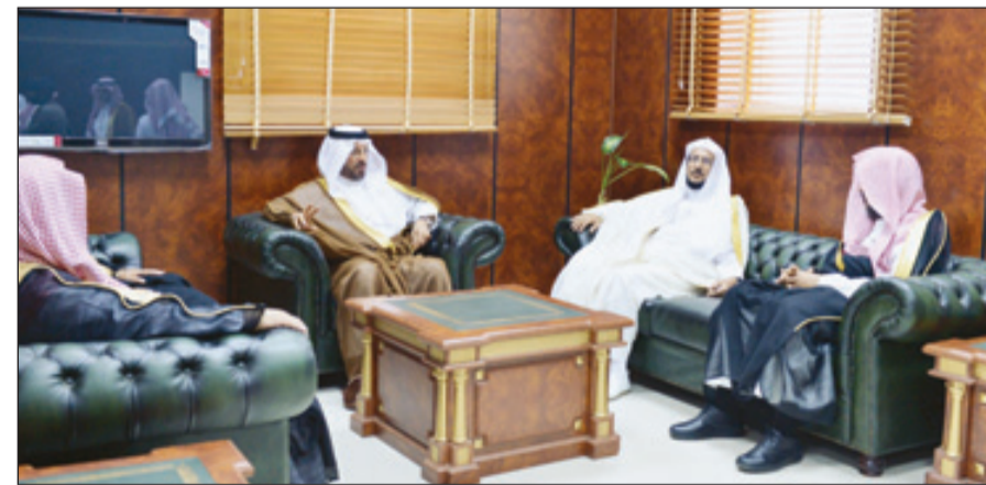
سموه يجتمع بالدكتور عبداللطيف آل الشيخ