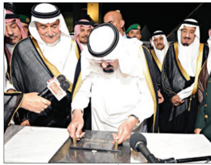
الملك يضع حجر أساس توسعة الحرم النبوي