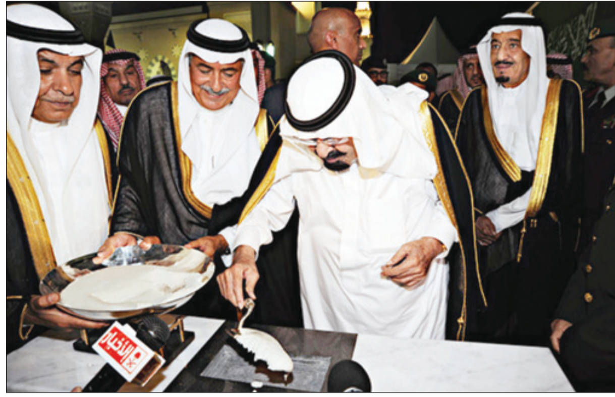
خادم الحرمين يضع حجر الأساس للمشروع