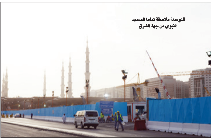
التوسعة ملاصقة تماماً للمسجد النبوي من جهة الشرق