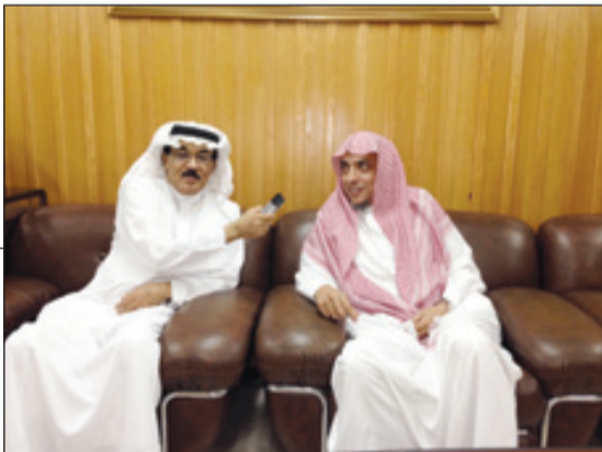
وكيل الرئيس العام للمسجد النبوي يتحدث لـ "الرياض"

بين المسجد القديم والتوسعة السعودية الأولى فقد تم إقامة اثنتي عشرة مظلة ضخمة بنفس ارتفاع السقف تظل كل منها مساحة ٣٠٦ أمتار مربعة يتم فتحها وغلقتها