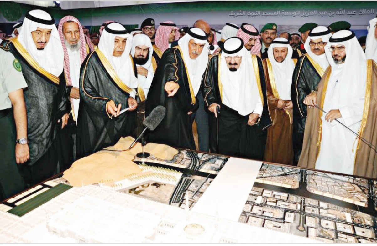
خادم الحرمين يطلع على نموذج للمشروع