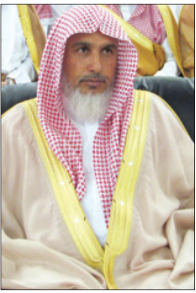
الشيخ صالح الجُمَيْدِي