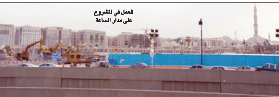
العمل في المشروع على مدار الساعة

المشروع إضافة مساحات كبيرة جداً من جهات الشرق والشمال والغرب تتسع عند انتهاء المشروع لحوالي مليون و٦٠٠ ألف مصل وتنتم التوسعة الجديدة بالكثير من المواصفات الحديثة والمتطورة خاصة في مداخل الحرم ومخارجه ودورات المياه والسلام الكهربائية ومصاعد ذوي الاحتياجات الخاصة والخدمات الأمنية ووحدات التكييف المركزية الحديثة مع إضافة مظلات جديدة في ساحات الحرم الجديدة لتقي المصلين حرارة الشمس صيفاً وبرودة الاجواء والأمطار في الشتاء. ويتضمن المشروع إضافة مبنى جديد بجانب مبنى المسجد الصالي يحيط ويتصل به من الشمال والشرق والغرب بمساحة قدرها ٨٢٠٠٠ متر مربع يستوعب ١٦٧٠٠٠ مصل وبذلك تصبح المساحة الإجمالية للمسجد النبوي الشريف ٩٨٥٠٠ متر مربع كما أن سطح التوسعة تم تغطيته بالرخام والقدره مساحته بـ ٦٧٠٠٠ متر مربع ليستوعب ٩٠٠٠٠ مصل، وبذلك يكون استيعاب المسجد النبوي الشريف بعد التوسعة أكثر من ٢٥٧٠٠٠ مصل ضمن مساحة إجمالية تبلغ ١٦٥٠٠٠ متراً مربعاً، وتتضمن أعمال التوسعة إنشاء دور سفلي (بدروم) بمساحة الدور الأرضي للتوسعة وذلك لاستيعاب تجهيزات التكييف والتبريد والخدمات الأخرى. كما يشتمل المشروع إحاطة المسجد النبوي الشريف بساحات تبلغ مساحتها