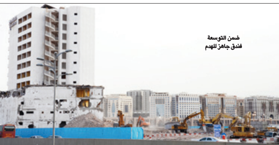
ضمن التوسعة فندق جاهز للهمم