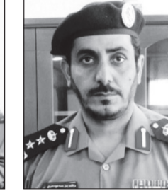
العقيد راشد المري