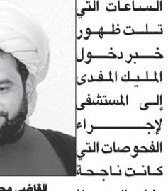
القاضي محمد الجبراني