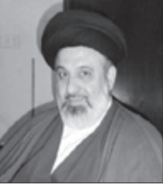
القاضي وجيه الأوجامي