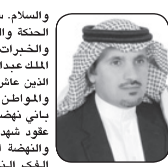
حمد فراج الجمهور

والسلام. سلمان القائد الفذ صاحب الحكمة والسياسة والرأي السديد والخبرات التي اكتسبها من والده الملك عبدالعزيز واخوانه الملوك الذين عاش معهم يحمل هم الوطن والمواطن ونصرة الدين. سلمان باني نهضة الرياض طوال خمسة عقود شهدت العاصمة كل التطور والنهضة الشاملة. سلمان صاحب الفكر النير والرؤية السديدة والحكمة لرجل يقود الوطن في مرحلته الطموحة والتنموية القادمة. سلمان يعاضده اخوانه وأبناؤه وشعبه لمسيرة جديدة من العز والرفق للوطن وللشعب. سلمان وفقه الله واعاك على القيام بمسئوليات الجسام في خدمة الحرمين الشريفين وخدمة قاصديهما وخدمة المسلمين وخدمة شعبك الوفي والمخلص. نبايعك والشعب على السمع والطاعة.