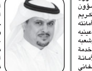
فهد بن أحمد الصالح

فان الحزن عليه اكثر من الحزن على الوالد لان الحزن على الوالد هو حزن خاص ولكن الحزن والفقد على عبدالله بن عبدالعزيز حزن عام وقد بحجم الكون، وخسارة الوالد هي خسارة شخصية ولكن خسارة عبدالله بن عبدالعزيز خسارة للإنسانية التي كان يمثلها بكل قيمها السامية ويضمّن معها العيش الكريم لو طبقتها شعوب الارض. في كل رحلة له كنا نستودع الله دينه وامانته وخواتيم عمله ونتابع مسيرته ونفرح بما يقدم للمواطن السعودي واليوم قد توقفت روحه ولم تتوقف عطاءاته لان الوالد هي عيش الان مزدهرا بمشاريع عملاقة بدأها رحمه الله ولم تنته بعد، وحتى بعد انجازها لن تتوقف ذكراه ولا الحنين اليه ولا الدعاء له وقد استودعناه الله الذي لا تصعب واداعه ان يجعله في زمة الصديقين والشهداء والصالحين ونسأله ان يجزيه عما قدم خير الجزاء لوطنه ومواطنيه وامته العربية والإسلامية، والناس شهود الله في ارضه مترجمة الحب الصادق لمن احبها بصدق، والحزن الاليم على من يحزنه حزن شعبه وامته، وان كان المصاب جلالاً والفرق مؤثماً فنحمد الله على فضائه وقدره ولا نقول في ذلك الا (انا لله وانا اليه راجعون)