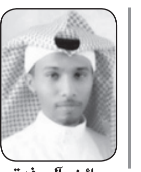
عائض آل رفة

رحل الملك عبدالله الرجل الصالح المحب لشعبه وأمته. رحل الرجل الذي يستمد قوته بالله سبحانه ثم بشعبه. رحل الرجل الذي يرفض ان يقبل احد يده. رحل عنا الرجل الذي احب شعبه ووطنه رحل ابو متعب عنا بجسده الطاهر ولكن ذكره ووقفاته ومبادراته باقية بيننا وفي قلوبنا لا ننساها. غادرتنا ملك نجبة وقدم لنا ملك نجبه تولى أمر الوطن وكل قلب الشعب ترنو له بمواصلة مسيرة الخير والعز ملكنا سلمان بن عبدالعزيز خير الرجال وصاحب المقام والمكانة والعالية ابن الملك عبدالعزيز واخ ملوكنا الكرام الذين قادوا الوطن المعالي والرفي. سلمان قائد الوطن. سلمان الخير والمحبة