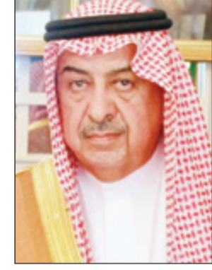
فهد بن معمر

الطائف - اسماعيل ابراهيم ■ رفع معالي محافظ الطائف فهد بن عبدالعزيز بن معمر التهاني لخدمته من محافظ الطائف الدكتور عبدالعزیز، وسمو ولي عهد الأمين، وسمو ولي عهد - حفظهم الله - على الدعم المتواصل لكل ما فيه توفير أرقى الخدمات للمواطنين في ظل الدعم المستمر من صاحب السمو الملكي الأمير الدكتور منصور بن متعب بن عبدالعزيز وزير الشؤون البلدية والقروية لكافة الامانات والبلديات لتعزيز الخدمات البلدية المقدمة للمواطنين في كل مكان.. ودعا الله العلي القدير أن يوفق هذه البلاد الغالية وقيادتها الحكيمة لمواصلة تحقيق الطموحات المعقودة وأن تتكفل الجهود الخيرة لخدمة الوطن والمواطن بالنجاح..