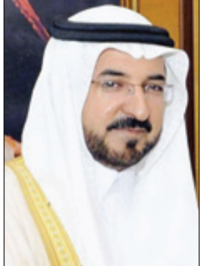
الدكتور حامد الشمري

الباحة - مشعل السوادي ■ أشاد وكيل إمارة منطقة الباحة الدكتور حامد بن صالح الشمري، بما حملته الميزانية العامة للدولة للعام المالي الجديد ١٤٣٦ - ١٤٣٧ هـ من خير تحقيقاً لتطلعات ورغبات المواطنين في شتى المجالات. وقال الشمري بهذه المناسبة: إن خادم الحرمين الشريفين الملك عبدالله بن عبدالعزيز آل سعود - حفظه الله - حرص على أن تكون هذه الميزانية في مستوى تطلعات المواطنين وتحقق رغباتهم من مشاريع الخير والنماء لتواصل المسيرة المباركة لهذه البلاد المعطاءة. وأضاف أنه مما لا شك فيه أن ميزانية هذا العام ستكون رافداً مهماً لاستكمال وإنشاء مشاريع جديدة في جميع مناطق المملكة ومنها منطقة الباحة التي حظيت بمشاريع حيوية في شتى المجالات والتي ستسهم في تحقيق الراحة والرفاهية للمواطن، سائلاً الله أن يحفظ لهذه البلاد قدامتها وأن يديم عليها أمنها واستقرارها.