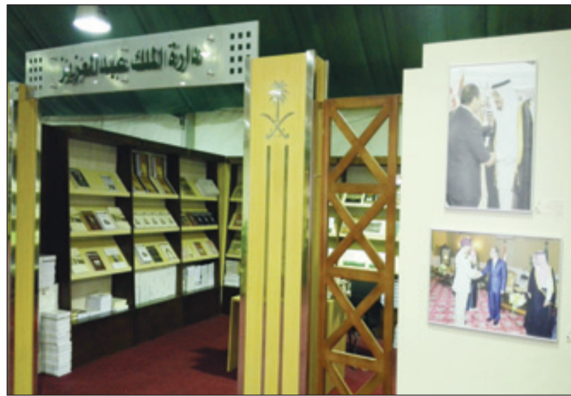
جناح الدارة في معرض القاهرة احتوى كتباً ومعاجم توثق للعلاقات المصرية السعودية

خادم الحرمين الشريفين الملك عبدالله بن عبدالعزيز -رحمه الله- والرئيس المصري عبدالفتاح السيسي، وصورا لمعالم حضارية ومعالم تاريخية وسياحية سعودية. الجدير بالذكر أن الدارة أصدرت كتاباً عدة توثق للعلاقات المصرية المصرية هي: