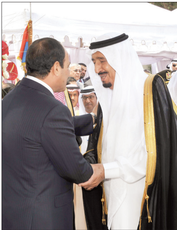
الملك سلمان يصافح الرئيس المصري خلال مراسم تنصيبه

شمل كتباً توثق للعلاقات السعودية المصرية منذ عهد المؤسس