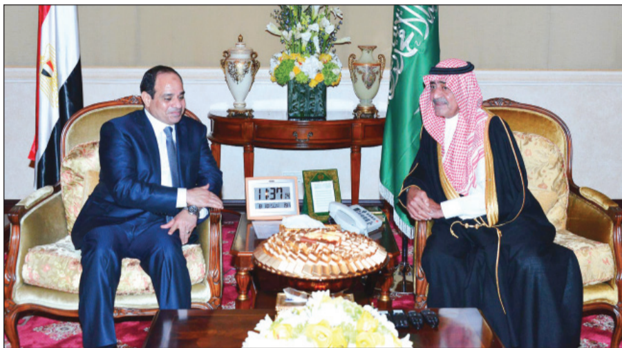
الرئيس المصري وولي العهد خلال أحد اللقاءات

وقدمت الدارة هدية لزوار الجناح السعودي عبارة عن كتاب بعنوان (المملكة العربية السعودية التاريخ والمستقبل) ضم ٣٥ لوحة مشاركة في المعرض المصاحب الذي تنظمه الدارة ضمن الجناح السعودي، ويحتوي الكتاب على معلومات تاريخية عن موقع المملكة العربية السعودية، ومعلومات عن حضارتها التنموية، وتطلعاتها المستقبلية تجاه التطور والتحديث، وواقع العلاقات بين المملكة العربية السعودية ومصر، وضم الكتاب أيضاً صوراً لزيارة الملك عبدالعزيز -طيب الله ثراه- للملك فاروق في مصر عام ١٩٤٦م، وصوراً للقاء التاريخي بين