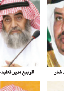
الربيع مدير تعليم صبيا