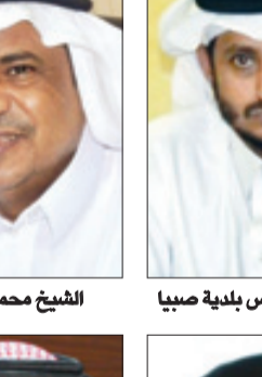
الشيخ محمد القنوي