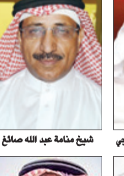
شيخ منامة عبد الله صالح

أكد الدكتور عبدالرحمن بن عبيد اليوبي مدير جامعة الملك عبدالعزيز وجامعة جدة المكلف، أن خادم الحرمين الشريفين الملك عبدالله بن عبدالعزيز، قاد هذا الوطن الغالي إلى التقدم والأزدهار وتحقيق الأمن والاستقرار، بفضل الله تعالى ثم بما قام به - أيده الله - من أدوار قيادية متميزة أساسها الاهتمام والعناية بالشعب، والسعي نحو تطبيق العدالة والمساواة بحكمة واقتدار.