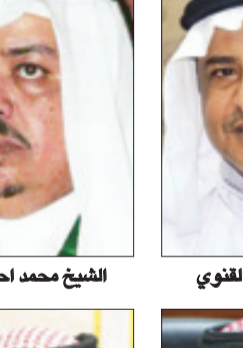
الشيخ محمد احمد شار