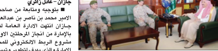
الأمير محمد بن ناصر خلال لقائه قائد سلاح المشاة

جازان - عادل زائري التقى صاحب السمو الملكي الأمير محمد بن ناصر بن عبدالعزيز أمير منطقة جازان بمكتبه بالإمارة يوم أمس قائد سلاح المشاة اللواء عبدالله بن سعيد القحطاني والوفد المرافق الذي يزور المنطقة حالياً. ورحب سمو أمير المنطقة باللواء القحطاني والوفد المرافق متمنياً لهم التوفيق في المهام الموكلة إليه خلال الزيارة وتبادل خلال اللقاء الأحاديث الودية.