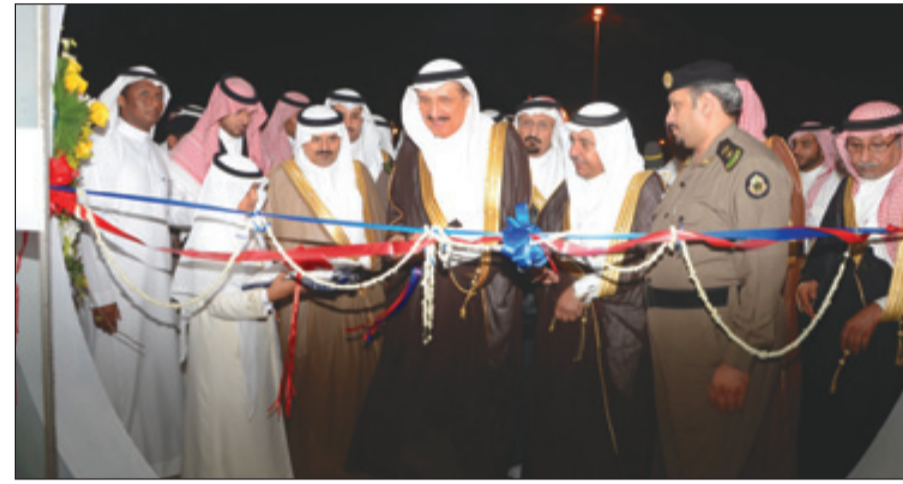
الأمير محمد بن ناصر خلال تدشين المستشفى

وتسلّم سموه هدية تذكارية بهذه المناسبة وعبر سموه في تصريح صحفي عقب حفل الافتتاح عن سعادته برعاية حفل تدشين المستشفى وما استمع إليه من شرح عن المستشفى والخدمات التي يقدمها وما يتوافر به من أجهزة متطورة وكوادر وطنية مؤهلة في شتى المجالات والتخصصات الطبية. واستعرض سموه سير العمل بالمشروعات الصحية العاملة بالمنطقة التي تحت التنفيذ وما سيتم تدشينها، ومنها مستشفى الأمير محمد بن ناصر الذي يستقبل الحالات التخصصية في مجالات القلب والأورام وغيرها من الحالات، ومستشفى الصحة النفسية والمستشفى التخصصي الذي تم اعتماده والبداية في تنفيذه بسعة سريرية تصل لـ ٥٠٠ سرير، ومستشفيات جنوب وشرق وشمال جازان بسعة سريرية تتراوح بين ٢٠٠ و ٣٠٠ سرير، وغيرها من المشروعات الصحية الأخرى. وجدد سموه الدعوة لرجال الأعمال والمستثمرين للاستثمار بالمنطقة في شتى المجالات ومنها المجالات الطبية والصحية وإنشاء المستشفيات، مؤكداً حرص ودعم الإمارة للمستثمرين وتقديم كل التسهيلات التي يحتاجون لها من قبل مختلف الجهات الحكومية.