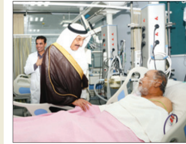
.. ويؤبر المرضى