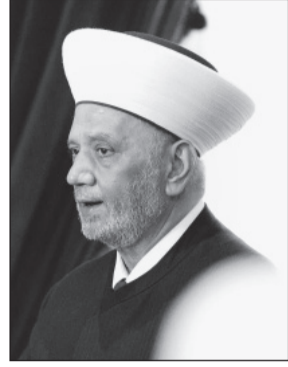
الشيخ عبدالله الطيف بريان

المملكة الكامل والشامل للبنان في الحفاظ على وحدة شعبه ودعم مؤسساته. وقد شكره وتقديره لسمو ولي العهد بين أتباع الأديان، والحوار الوطني في المملكة العربية السعودية ورأب الصدع العربي، مؤكداً أن كل هذه المحاولات والجهود تعزز الرأي بأن جهود المملكة مسبوقة ومشكورة ومستمرة.