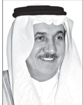
د. عبدالرحمن البراك

قمة الرياض وما نتج عنها من لم تشمل البيت الخليجي، ما نحن الان والله الحمد ويجهد هذا الرجل العظيم نشاهد فتح صفحة جديدة من العلاقات بين الشقيقتين قطر ومصر وتصفيية الاجواء بينهما مما شاب العلاقة فيما مضى بين البلدين، وكان ذلك نتاجاً لما اطلقه الملك المفدى من مبادرة خير واصلاح بين الاشقاء، كان ولازال هدفها الاول والاخير كما عهدنا منه