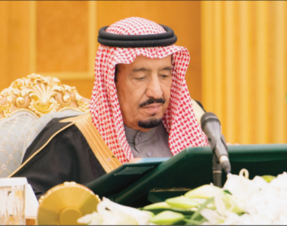
الأمير سلمان مترسلاً جلسة مجلس الوزراء

تنفيذ مشاريع معتمدة بقيمة (١٨٥) ملياراً.. واستمرار القروض الحكومية.. ودعم مشاريع الصحة والخدمات الأمنية والبلدية والطرق ميزانية التنمية الشاملة: الإيرادات ٧١٥ ملياراً والمصروفات ٨٦٠ ملياراً خادم الحرمين: الأولوية لاستكمال المشاريع المقررة وتطوير التعليم وتحسين الخدمات وإيجاد مزيد من الفرص الوظيفية توجيهاتنا بأن تأخذ الميزانية بعين الاعتبار انخفاض أسعار البترول.. ومتفائلون من أن النمو الاقتصادي سيستمر الأمير سلمان: بلادنا تنعم بالأمن والاستقرار.. والميزانية فيها الخير والبركة.. وتوجيهات الملك أن تكون في خدمة الوطن والمواطن