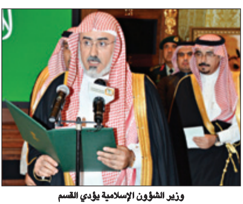
وزير الشؤون الإسلامية يؤدي القسم