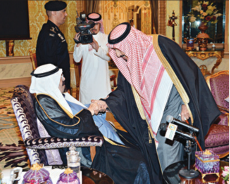
خادم الحرمين مصالفاً ولي العهد