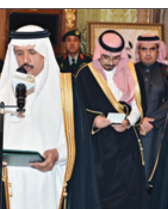
وزير الصحة يؤدي القسم

الرياض - واس تشرف بإداء القسم أمام خادم الحرمين الشريفين الملك عبدالله بن عبدالعزيز آل سعود . حفظه الله في قصره بالرياض مساء أمس أصحاب المعالي الوزراء الذين صدرت الأوامر الملكية الكريمة بتعيينهم في مناصبهم الجديدة، وهم معالي وزير الشؤون الإسلامية والأوقاف والدعوة والإرشاد الدكتور سليمان بن عبدالله أبو الخليل ومعالي وزير التعليم العالي الدكتور خالد بن عبدالله السبتي ومعالي وزير الصحة الدكتور محمد بن علي بن هيازع آل هيازع ومعالي وزير الثقافة والإعلام الدكتور عبدالعزيز بن عبدالله الخضير ومعالي وزير الاتصالات وتقنية المعلومات الدكتور فهد بن معتمد بن شفق الحمد ومعالي وزير الشؤون الاجتماعية الأستاذ سليمان بن سعد الحميد ومعالي وزير الزراعة المهندس وليد بن عبدالكريم الخريجي ومعالي وزير النقل المهندس عبدالله بن عبدالرحمن المقبل ومعالي وزير الدولة عضو مجلس الوزراء رئيس هيئة الخبراء بمجلس الوزراء الدكتور عصام بن سعد بن سعيد (كل على حدة) قائلين: (بسم الله الرحمن الرحيم . أقسم بالله العظيم أن أكون مخلصاً لديني، ثم للملكي وبلادتي، وأن لا أبوح بسر من أسرار الدولة، وأن أحافظ على مصالحها وأمنها، وأن أؤدي أعمالي بالصدق والأمانة والإخلاص). وقد أعرب الملك المفدى عن تهنئته لهم، داعياً المولى عز وجل أن يوفقهم لخدمة دينهم ووطنهم.