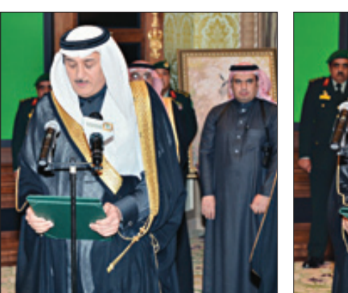
وزير الثقافة والإعلام يؤدي القسم