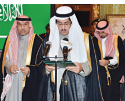
رئيس هيئة الخبراء أثناء إلقاء القسم