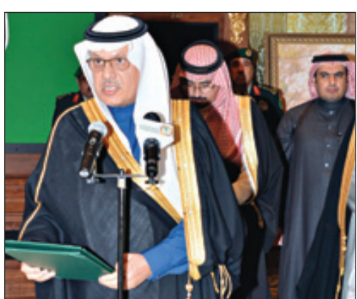
وزير النقل يؤدي القسم