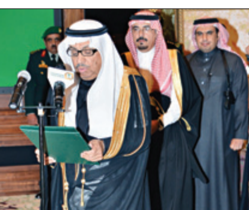
وزير الشؤون الاجتماعية يؤدي القسم