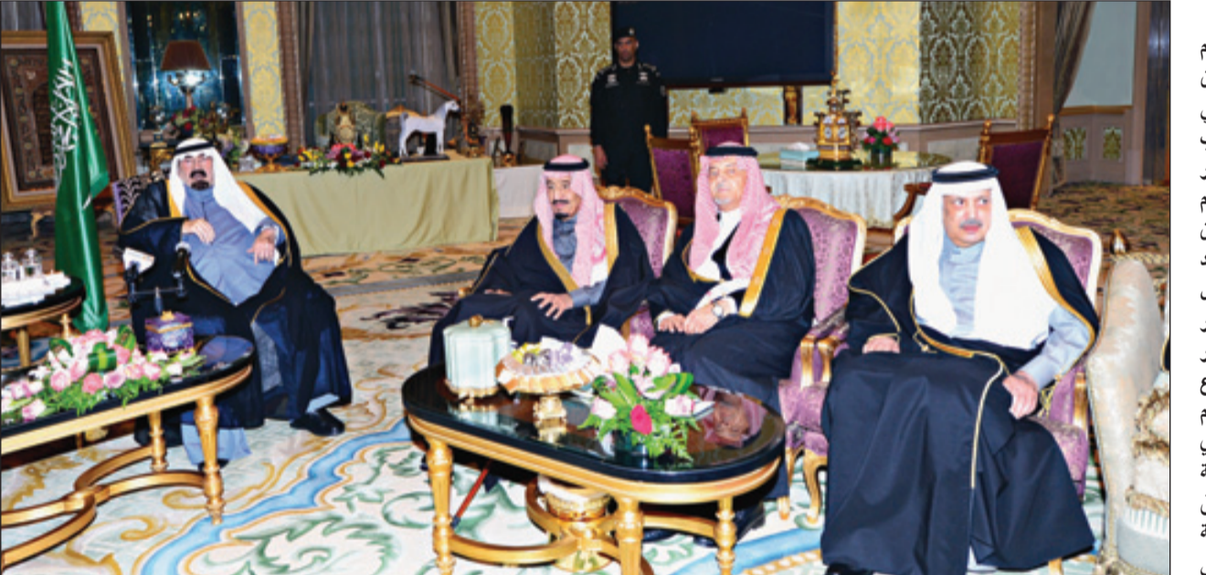
خادم الحرمين لدى تشرف الوزراء باداء القسم امامه