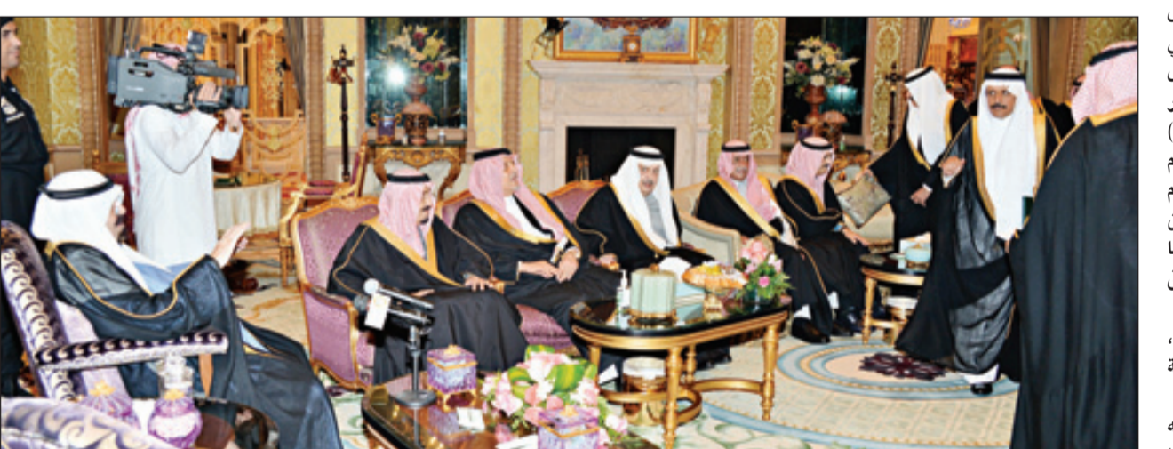
جانب من أداء القسم