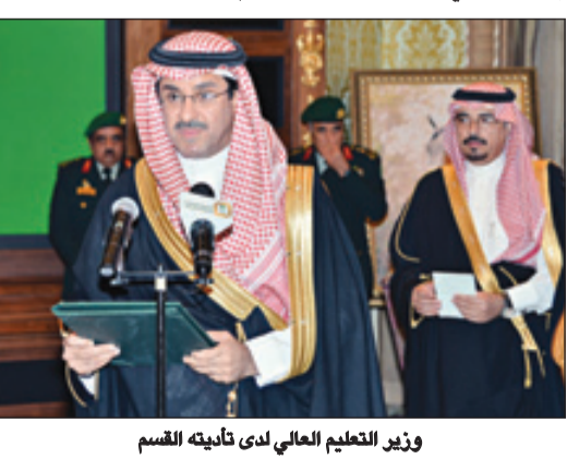
وزير التعليم العالي لدى تأديته القسم