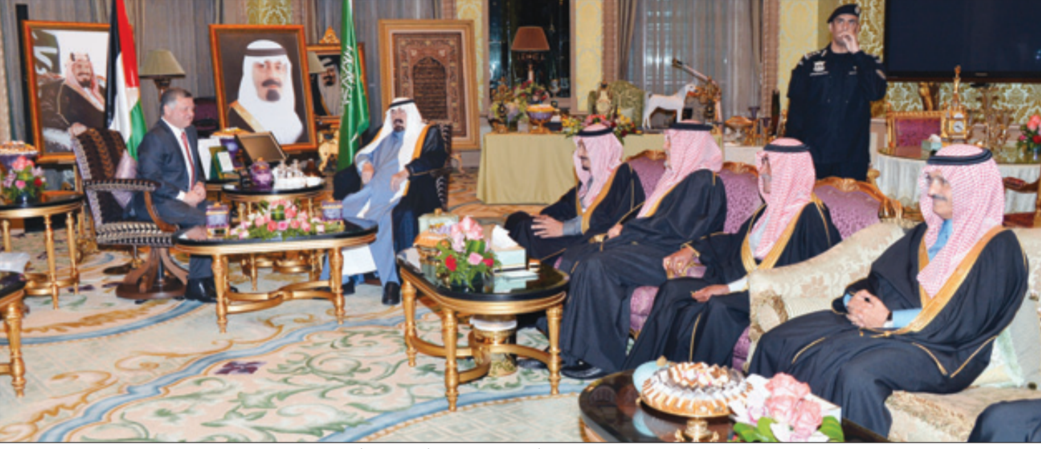
جانب من الاستقبال وفي الصورة ولي العهد والأمير سعود الفيصل والأمير مقرن والأمير خالد بن بندر