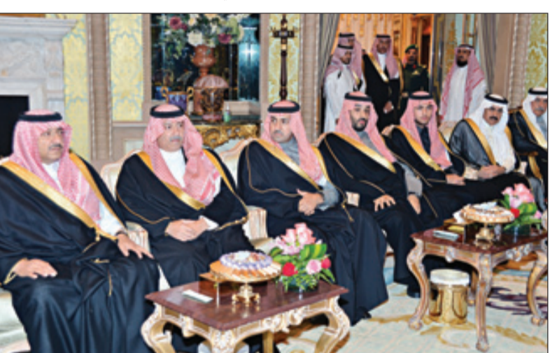
أصحاب السمو الملكي والوزراء خلال تأدية القسم