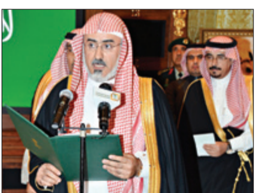
وزير الشؤون الإسلامية يؤدي القسم