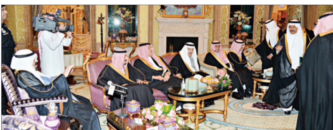
جانب من أداء القسم

الرياض - واس ■ تشرف بأداء القسم أمام خادم الحرمين الشريفين الملك عبدالله بن عبدالعزيز آل سعود . حفظه الله في قصره بالرياض مساء أمس أصحاب المعالي الوزراء الذين صدرت الأوامر الملكية الكريمة بتعيينهم في مناصبهم الجديدة، وهم معالي وزير الشؤون الإسلامية والأوقاف والدعوة والإرشاد الدكتور سليمان بن عبدالله أبا الخيل ومعالي وزير التعليم العالي الدكتور خالد بن عبدالله السبتي ومعالي وزير الصحة الدكتور محمد بن علي بن هيازع آل هيازع ومعالي وزير الثقافة والإعلام الدكتور عبدالعزيز بن عبدالله الخضير ومعالي وزير الاتصالات وتقنية المعلومات الدكتور فهد بن معتمد بن شفق الحمد ومعالي وزير الشؤون الاجتماعية الأستاذ سليمان بن سعد الحميد ومعالي وزير الزراعة المهندس وليد بن عبدالكريم الخريجي ومعالي وزير النقل المهندس عبدالله بن عبدالرحمن المقبل ومعالي وزير الدولة عضو مجلس الوزراء رئيس هيئة الخبراء بمجلس الوزراء الدكتور عصام بن سعد بن سعيد (كل على حدة) قائلين: (بسم الله الرحمن الرحيم .. أقسم بالله العظيم أن أكون مخلصاً لديني، ثم للملكي وبلادتي، وأن لا أبوح بسري من أسرار الدولة، وأن أحافظ على مصالحها وأمنها، وأن أؤدي أعمالي بالصدق والأمانة والإخلاص). وقد أعرب الملك المفدى عن تهنئته لهم، داعياً المولى عز وجل أن يوفقهم لخدمة دينهم ووطنهم.