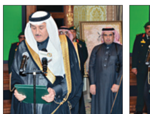
وزير الثقافة والإعلام يؤدي القسم