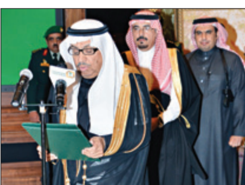
وزير الشؤون الاجتماعية يؤدي القسم