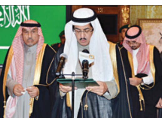
رئيس هيئة الخبراء أثناء إلقاء القسم