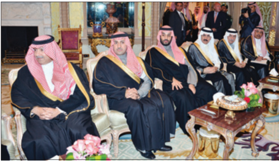
أصحاب السمو الملكي الأمراء خلال الاستقبال

سلمان بن عبدالعزيز وزير الدولة عضو مجلس الوزراء رئيس ديوان سمو ولي العهد المستشار الخاص لسموه، ومعالي وزير الدولة عضو مجلس الوزراء الدكتور مساعد بن محمد العيبان، ومعالي وزير المالية الدكتور إبراهيم بن عبدالعزيز العساف. كما حضره من الجانب الأردني دولة رئيس الديوان الملكي الهاشمي الدكتور فايز الطراونة، ومعالي وزير الخارجية وشؤون المغتربين الأستاذ ناصر جودة، ومعالي مدير مكتب جلالة الملك الأستاذ جعفر حسان، ورئيس هيئة الأركان المشتركة الفريق أول الركن مشعل الزين، ومدير المخابرات العامة الفريق أول فيصل الشويكي، ومعالي سفير الأردن لدى المملكة الأستاذ جمال الشميلة.