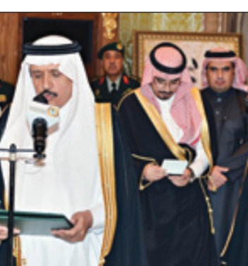
وزير الصحة يؤدي القسم

بن عبدالعزيز آل سعود ولي ولي العهد النائب الثاني لرئيس مجلس الوزراء المستشار والمبعوث الخاص لخادم الحرمين الشريفين وصاحب السمو الملكي الأمير خالد بن بندر بن عبدالعزيز رئيس الاستخبارات العامة وصاحب السمو الملكي الأمير مقرن بن عبدالعزيز وزير الحرس الوطني وصاحب السمو الملكي الأمير محمد بن نايف بن عبدالعزيز وزير الداخلية وصاحب السمو الملكي الأمير عبد الله بن عبدالعزيز نائب وزير الحرس الوطني