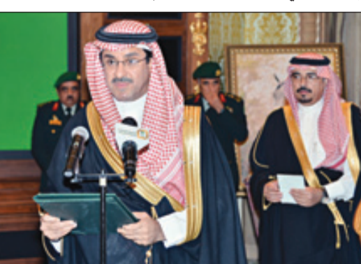
وزير التعليم العالي لدى تأديته القسم

الرياض - واس ■ تشرف بأداء القسم أمام خادم الحرمين الشريفين الملك عبدالله بن عبدالعزيز آل سعود . حفظه الله في قصره بالرياض مساء أمس أصحاب المعالي الوزراء الذين صدرت الأوامر الملكية الكريمة بتعيينهم في مناصبهم الجديدة، وهم معالي وزير الشؤون الإسلامية والأوقاف والدعوة والإرشاد الدكتور سليمان بن عبدالله أبا الخيل ومعالي وزير التعليم العالي الدكتور خالد بن عبدالله السبتي ومعالي وزير الصحة الدكتور محمد بن علي بن هيازع آل هيازع ومعالي وزير الثقافة والإعلام الدكتور عبدالعزيز بن عبدالله الخضير ومعالي وزير الاتصالات وتقنية المعلومات الدكتور فهد بن معتمد بن شفق الحمد ومعالي وزير الشؤون الاجتماعية الأستاذ سليمان بن سعد الحميد ومعالي وزير الزراعة المهندس وليد بن عبدالكريم الخريجي ومعالي وزير النقل المهندس عبدالله بن عبدالرحمن المقبل ومعالي وزير الدولة عضو مجلس الوزراء رئيس هيئة الخبراء بمجلس الوزراء الدكتور عصام بن سعد بن سعيد (كل على حدة) قائلين: (بسم الله الرحمن الرحيم .. أقسم بالله العظيم أن أكون مخلصاً لديني، ثم للملكي وبلادتي، وأن لا أبوح بسري من أسرار الدولة، وأن أحافظ على مصالحها وأمنها، وأن أؤدي أعمالي بالصدق والأمانة والإخلاص). وقد أعرب الملك المفدى عن تهنئته لهم، داعياً المولى عز وجل أن يوفقهم لخدمة دينهم ووطنهم.