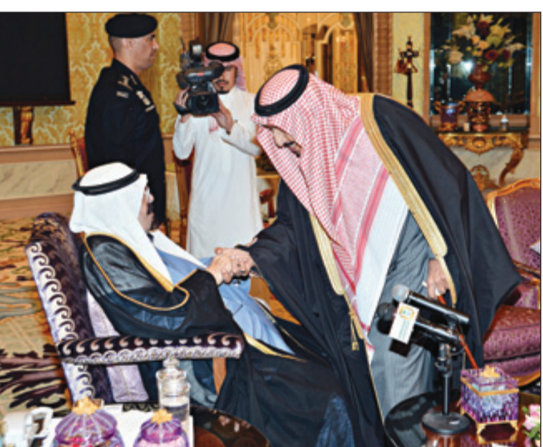
خادم الحرمين مصالفاً ولي العهد