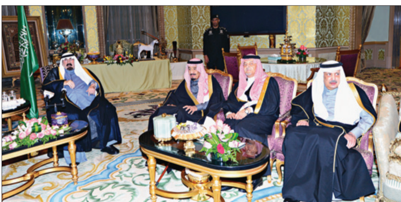
خادم الحرمين لدى تشرف الوزراء بأداء القسم أمامه