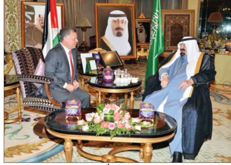
خادم الحرمين مستقبلاً ملك الأردن