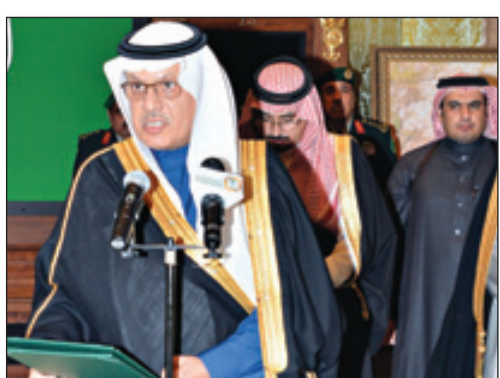
وزير النقل يؤدي القسم