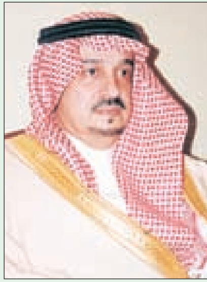
الأمير فيصل بن بندر أمير منطقة القصيم