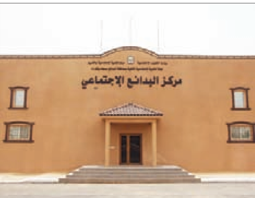
صورة مبنى لجنة التنمية الاجتماعية الأهلية بالبدائع