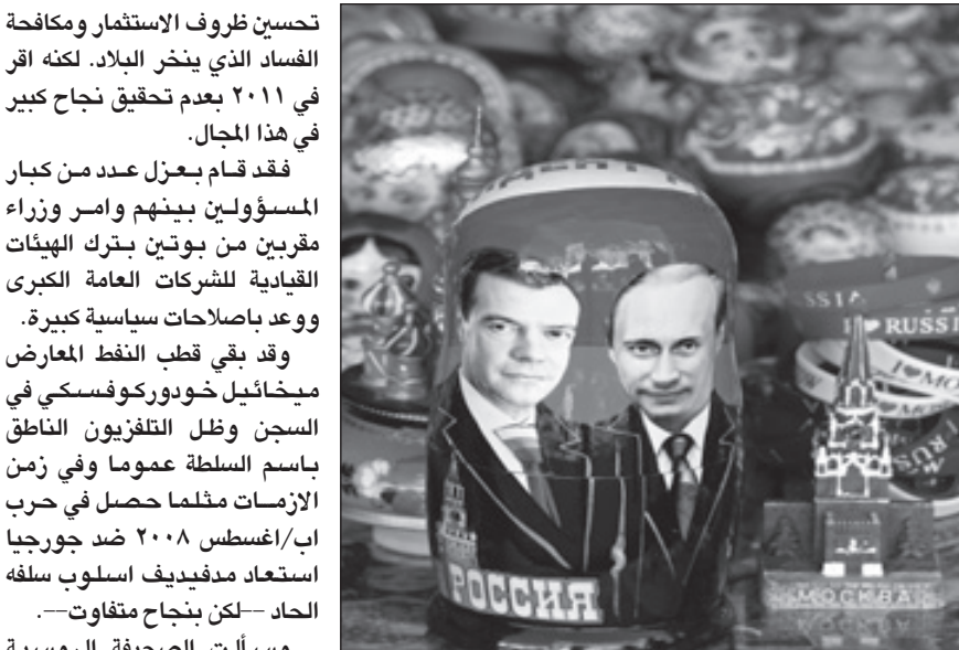
بالع في موسكو يعرض سلعة عليها صورة الرئيس ميديفيدف وبوتين الذي يتسلم الرئاسة غدا

فهو لم يخف ميله الى موسيقى الروك الغربية والتكنولوجيا الحديثة او حتى تويتير، وجعل من تحديث روسيا شعاره داعيا الى