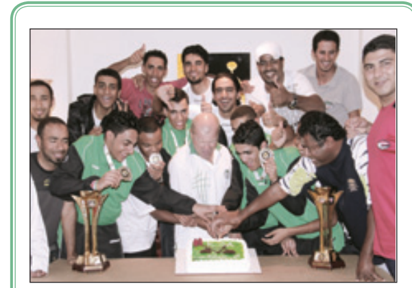
البيعة السعودية تحتفل

اختتمت أخيراً البطولة الاولى لرياضة التاي بوكسغ في مدينة جدة، والتي تنظم بإشراف الإتحاد العربي للتاي بوكسغ وبمتابعة مباشرة من اللجنة السعودية شارك فيها أكثر من ١٥٠ لاعبا يشاركون في بطولة التاي بوكسغ الاولى. وكشف الرئيس الفخري للإتحاد العربي للتاي بوكسغ الامير محمد بن تركي بن سعود الكبير ان هذه البطولة تأتي لتشجيع ونشر هذه الرياضة التي لاقت رواجاً وانتشاراً ملحوظاً في السعودية باعتبارها رياضة جديدة. مشيراً الى انه "مضى على دخولها قرابة عامين وتجاوز عدد لاعبيها ٧٠٠ شخص وكنا نطمح الى ان يصل عدد اللاعبين الى ١٠٠٠ لاعب ولكننا من خلال هذه البطولة الاولى سيتجاوز عدد اللاعبين الف لاعب في السعودية". وأكد الامير محمد انه تم رصد مبلغ ٥٠٠ الف ريال لهذه البطولة باعتبارها الاولى في السعودية ورصدت جوائز نقدية للمشاركين وسيارة لأفضل لاعب.