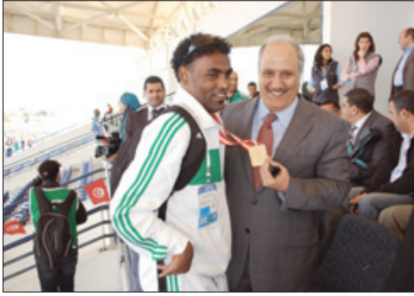
الدرعان أثناء التتويج

الرياض - "الرياض" حقق المنتخب السعودي لرياضة ذوي الاحتياجات الخاصة برونزيتين للسعودية في اليوم الثاني لمنافسات ملتقى تونس الدولي السادس لألعاب القوى لرياضة ذوي الاحتياجات الخاصة بمشاركة ٤٥٠ لاعبا يمثلون ٤٥ دولة على ملعب رانس لألعاب القوى خلال الفترة من ٢٦-٢٩/٣/٢٠١٢م، وشهدت المنافسات حضور سفير السعودية لدى دولة تونس خالد العنقري الذي هنا