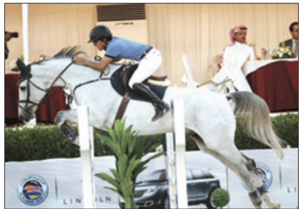
البطولة اقربت من النهاية

تحققت بفضل الله ثم بدعم خادم الحرمين الشريفين الملك عبدالله بن عبدالعزيز وولي عهده الأمين. وتشهد منافسات اليوم الى جانب الجائزة الكبرى التي تبلغ قيمتها المالية ٢٤٠ الف ريال، إقامة شوط نهائي الناشئين برعاية ساميا المالية وجائزته ٦٥ الف ريال وشوط جائزة مجموعة باحمدان وجائزته ٧٠ الف ريال. وتختتم البطولة غداً "الجمعة" بإقامة ثلاثة أشواط، الأول جائزة لكونون وجائزة للوطن الاضافية بقيمة ٤٢ الف ريال والشوط الاخير للوطن لتكريم المعتزلين وتبلغ الجائزة ١٠٠ الف ريال.